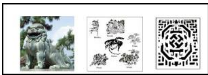
Gambar 1 Ornamen Arsitektur Cina Sumber : Moedjiono, 2011

Bangunan yang dihiasi dengan ornamen-ornamen khas Cina biasanya adalah kelenteng (rumah ibadah masyarakat Tiongkok/Cina), ada pula yang diaplikasikan pada masjid dan rumah-rumah masyarakat Cina itu sendiri. Peneliti mengamati terdapat beberapa masjid yang menggunakan ornament Cina pada bangunannya, salah satunya adalah Masjid Lama GangBengkok yang menggunakan nya pada bagian empat tiang penyanggah yang ada di dalam masjid dan penggunaan warna khas Cina pada atap masjid. Peletakan ornamen umumnya pada dinding, atap, pilar, pintu dan elemen interior lainnya sesuai dengan sifat dan maknanya. Secara umum jenis ornamen Cina yang biasa digunakan terdiri dari motif fauna (hewan), motif flora, fenomena alam, legenda, dan geometris.