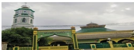
Gambar 11 Atap Masjid Lama Gang Bengkok

masjid-masjid biasanya menggunakan bentuk Kubah di atas atap masjid. Beda dengan halnya Masjid Lama Gang Bengkok, atap masjid ini sama sekali tidak ada berbentuk Kubah. Kecuali atap menara nya yang berbentuk kubah.