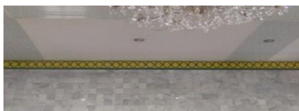
Gambar 6 Ornamen Persi pada langit – langit dinding bermotif “Itik Sekawan (awalan tanpa akhir)”

Lama Gang Bengkok bermotif lingkaran. Gelombang-gelombang berupa garis-garis yang diberi lengkung diulang-ulang saling berjaln hingga ujung-ujungnya bertemu dengan pangkalnya, menghasilkan kesamaan dan memancarkan gerakan berirama seperti berbentuk ornamen Itik sekawan atau bisa juga disebut sebagai awalan tanpa akhir. Makna ornamen itik sekawan ini menggambarkan tingkah laku hewan Itik yang selalu berjalan beriringan ketika petang hari akan pulang ke kandang. Tingkah laku berjalan beriringan serasi, bersahabat, kompak, bersama-sama, menjadi contoh bagi manusia akan arti kehidupan. Hal ini pun lalu digambarkan dan menjadi suatu corak motif untuk tenun, tekat, ukir, dan songket dengan nama Motif Itik Sekawan. Penggunaan warna pada dinding masjid dan dinding menara menggunakan warna pasir.