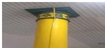
Gambar 2 Ornamen Tiang yang bermotif Flora seperti bunga dan daun

Ornamen Cina yang terdapat pada Masjid Lama Gang Bengkok yaitu bermotif flora. Bentuk ornamen bagian atas tiang yaitu bermotif bunga dan daun. Ornamen ini mengandung makna tentang unsur-unsur kehidupan dan kekuatan. Penggunaan warna hijau pada atap masjid yang maknanya untuk kedamaian dan keabadian, dan warna keemasan pada tiang penyanggah melambangkan makna kerajaan, kekukuhan, dan kekayaan ( Chinese Philosophy ).