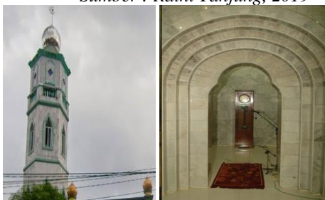
Gambar 7 Warna pasir pada dinding masjid