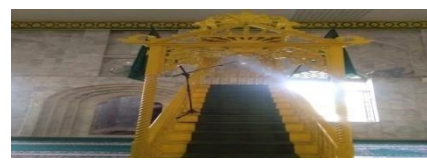
Gambar 10 Mimbar Khatib, simbolis arsitektur Persia