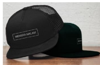
Gambar 5. Kaos dan Topi