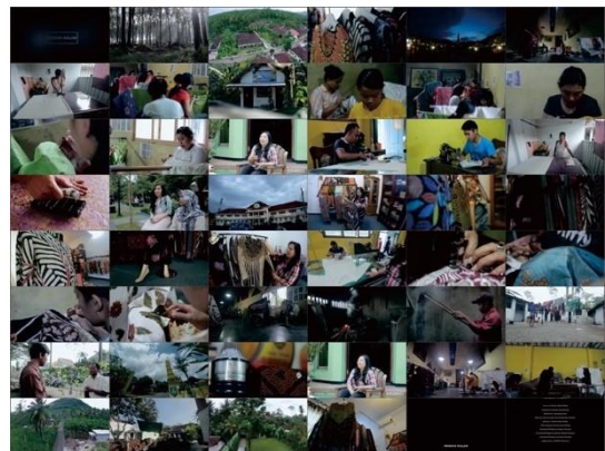
Gambar 2. Cuplikan Film Dokumenter