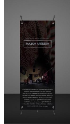
Gambar 4. X-Banner

X-banner merupakan media pendukung yang ditempatkan di area penayangan film atau screening . Media ini berfungsi sebagai tanda bagi orang yang sedang lewat atau mencari lokasi screening . Rancangan visual untuk media x-banner hampir sama dengan media pendukung lainnya terutama poster untuk tetap menjamin kesatuan atau unity . Ilustrasi yang digunakan merupakan ilustrasi fotografi yang sama dengan yang digunakan di dalam poster. X-banner ini dicetak full color pada vinyl ukuran 60x160cm. Pertimbangannya adalah media ini merupakan media yang fleksibel, baik dalam penggunaannya maupun pada proses pembuatannya. X-banner ini bisa diletakkan dimana saja.