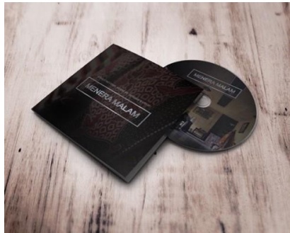
Gambar 3. DVD box

Rancangan visual pada cover DVD juga hampir sama dengan media poster. Visual utama dari poster ini adalah foto suasana membatik di Andis Batik Druju dengan editing yang memberikan kesan eye catching dengan adanya fokus motif batik sebagai sampul DVD box.