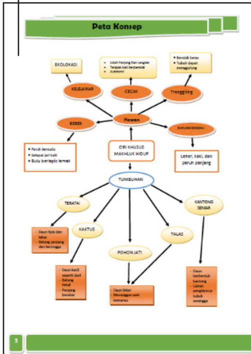
Gambar 3. Peta Konsep

Fitur Peta konsep untuk mempermudah pemahaman dan alur pembahasan sehingga membawa siswa untuk lebih belajar efektif