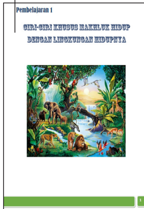
Gambar 2. Sub Judul

Setiap awal bab diberi desain menarik yang menggambarkan materi agar siswa lebih tertarik untuk mempelajarinya.