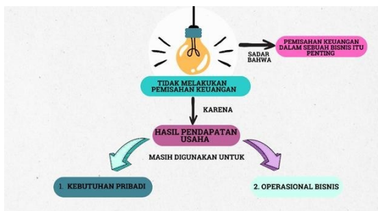
Gambar 1. Diagram Kontek Makna Pemisahan Keuangan Pribadi dan Keuangan Bisnis

Berdasarkan hasil wawancara tersebut dapat dilihat bahwa pengusaha sebenarnya sadar bahwa pemisahan antara keuangan pribadi dan keuangan usaha dalam sebuah bisnis penting. Mengingat bahwa usaha yang dijalankannya masih tergolong kecil, mereka tidak memisahkan antara keuangan pribadi dan bisnis. Selain itu, temuan tersebut juga menunjukkan masih rendahnya pemahaman dan pengetahuan pengusaha kecil dalam pengelolaan keuangan. Hal ini sesuai dengan penelitian yang dilakukan oleh (Khadijah & Purba, 2021) yang menemukan bahwa pelaku UMKM memiliki pemahaman dan pengetahuan yang rendah dalam mengelola keuangan perusahaan, yang berimplikasi bahwa pelaku usaha harus meningkatkan kinerjanya agar dapat bersaing.