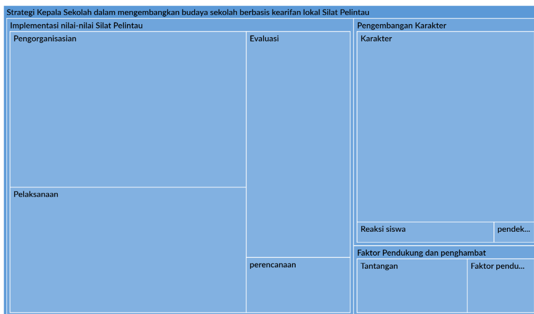
Gambar 2. Hierarchy chart strategi kepala sekolah dalam mengembangkan karakter siswa melalui Silat Pelintau