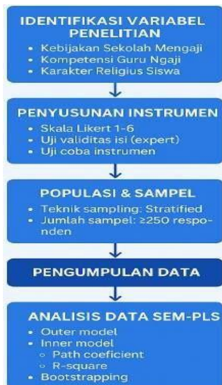
Gambar 1. Prosedur Pengolahan Data

dengan prosedur bootstrapping 5.000 resampling, sedangkan efek mediasi kompetensi guru dianalisis menggunakan Variance Accounted For (VAF). Aspek etika dipenuhi melalui pemberian informasi kepada responden mengenai tujuan penelitian, kerahasiaan data, serta persetujuan partisipasi secara sukarela.