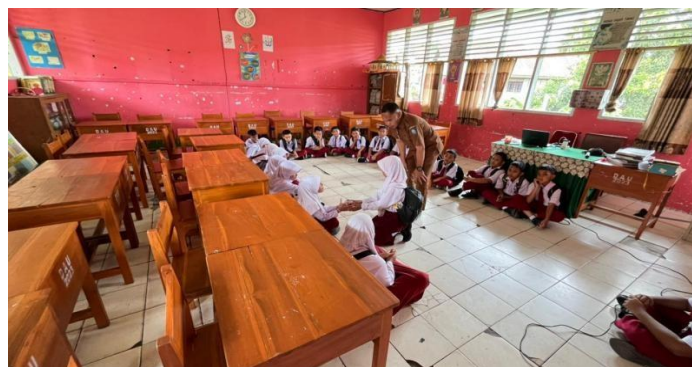
Gambar 2. Siswa dilibatkan dalam proses pembuatan konten

Data penelitian menunjukkan bahwa nilai-nilai pendidikan karakter yang dominan ditanamkan melalui konten media sosial meliputi nilai religius, disiplin, kerja sama, peduli sosial, semangat kebangsaan dan cinta tanah air, adab sopan santun, serta percaya diri. Nilai religius dan disiplin tercermin melalui dokumentasi pembiasaan pagi, kegiatan ibadah, dan kepatuhan siswa terhadap tata tertib sekolah. Nilai kerja sama dan peduli sosial ditampilkan melalui kegiatan berbagi dan program Ase Budu, sedangkan nilai semangat kebangsaan dan cinta tanah air terlihat pada dokumentasi peringatan hari-hari besar nasional dan kegiatan kebudayaan sekolah.