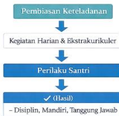
Gambar 4. Pelaksanaan Pengembangan Diri Santri

Pelaksanaan pengembangan diri santri tidak hanya berorientasi pada keterlibatan dalam kegiatan, tetapi juga pada pembentukan kebiasaan positif yang berlangsung secara berulang. Kegiatan harian di pesantren menjadi media utama dalam membentuk pola perilaku santri. Melalui rutinitas yang teratur, santri diarahkan untuk membangun kedisiplinan, tanggung jawab, kemandirian, dan kepedulian terhadap sesama.