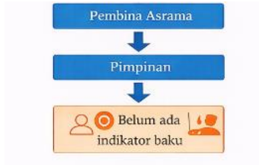
Gambar 5. Pengawasan

pengarahan, nasihat, dan pendampingan. Dengan demikian, pengawasan tidak hanya bersifat kontrol administratif, tetapi juga menjadi bagian dari proses pendidikan karakter.