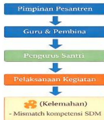
Gambar 3. Pengorganisasian Pengembangan Diri Santri

Pengorganisasian pengembangan diri santri juga memperlihatkan adanya ruang partisipasi bagi santri. Santri tidak hanya menjadi objek pembinaan, tetapi juga dilibatkan sebagai subjek yang ikut mengelola kegiatan. Keterlibatan ini tampak dalam pelaksanaan organisasi santri, pengelolaan kegiatan keagamaan, kegiatan sosial, kedisiplinan asrama, dan berbagai aktivitas ekstrakurikuler.