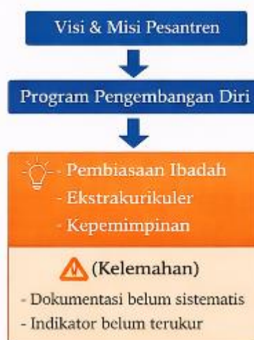
Gambar 2. Perencanaan Pengembangan Diri Santri

Perencanaan juga melibatkan unsur pimpinan pesantren, guru, dan pembina asrama. Keterlibatan berbagai unsur tersebut menunjukkan bahwa pengembangan diri santri tidak dirancang secara individual oleh satu pihak, tetapi melalui koordinasi kelembagaan. Meskipun demikian, hasil penelitian menemukan bahwa belum seluruh program memiliki indikator capaian karakter yang terdokumentasi secara rinci.