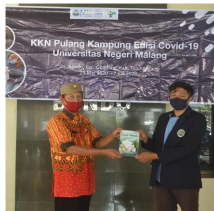
Gambar 6. Modul Olahan Tape dan Penyerahan Modul kepada Kepala Desa