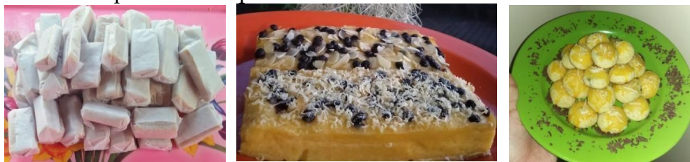
Gambar 2. Hasil Olahan Tape Berupa Permen Tape, Prol Tape, dan Nastar Tape

Pembuatan modul olahan tape dimulai dari membuat berbagai macam olahan tape yang dibuat sendiri oleh anggota kelompok Kegiatan Pengabdian Masyarakat UM. Dalam pembuatan olahan di mulai dari menentukan jenis bahan, cara pembuatan, sampai pengemasan olahan tape. Setelah berhasil membuat resep makanan olahan tape sendiri , kemudian ide tersebut kami tuangkan ke dalam buku resep berupa modul olahan tape. Modul olahan tape berjudul " Modul Pengembangan Olahan Tape Siput Manis (Singkong Putih Manis) Untuk meningkatkan Potensi Desa Bendo ". Modul ini berisi tentang 9 resep olahan tape, branding , dan contoh logo untuk produk olahan tape berupa logo produk nastar tape, permen tape, dan prol tape. Pembuatan modul olahan tape ini mendapat respon positif dari pihak desa Bendo, Kecamatan Gondang, Kabupaten Tulungagung. Penyerahan modul olahan tape dilakukan pada tanggal 7 Juli 2020 dilakukan oleh perwakilan kelompok program kerja modul olahan tape kepada kepala desa Bendo. Penyerahan modul kepada ibu-ibu PKK dilakukan melalui perantara kepala desa Bendo.