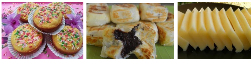
Gambar 3. Hasil Olahan Tape Berupa Bolu Tape, Tape Bakar, dan Pudding Tape