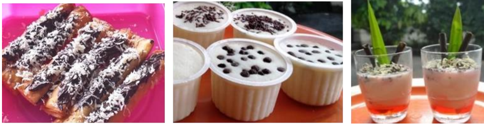
Gambar 4. Hasil Olahan Tape Berupa Stick Roll Tape, Es Krim Tape, dan Es Tape Susu