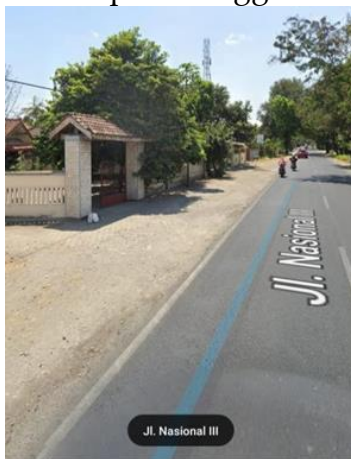
Gambar 1. Lokasi Kegiatan Pembuatan Modul Olahan Tape

pencetakan modul olahan tape. Diskusi ini menemui kesepakatan terkait modul olahan tape yaitu pembuatan 9 olahan tape, penentuan judul modul olahan tape, mencetak modul sebanyak 3, dan modul dibuatkan e-book. Dokumentasi dilakukan secara bergantian oleh anggota kelompok kecil. Perkiraan waktu yang kami butuhkan dari kegiatan diskusi hingga pembuatan modul olahan tape dapat diselesaikan 21 hari dimulai pada tanggal 30 Mei 2020 – 19 Juni 2020.