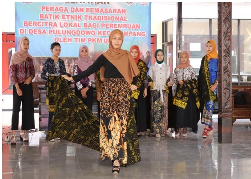
Gambar 4. Penampilan tampilan fashion show peserta secara bergantian

Peserta selama pelatihan yang berjumlah 15 orang telah mengikuti kegiatan dengan tertib dan memperhatikan dengan seksama serta mampu memperagakan ulang materi pelatihan, serta latihan dengan pendampingan tampilan fashion show . Sungguhpun pada pelatihan ini memang dirasa agak sulit, namun hasil tampilan menunjukkan adanya peningkatan keberanian peserta tampil telah mencapai 90% lebih baik. Kekurangan disarankan dapat diajukan pelatihan secara rutin yang dapat diselenggarakan secara mandiri oleh peserta atau pihak desa. Sehingga tampilan para peragawati dari Desa Pulungdowo mampu mengisi kegiatan-kegiatan yang diselenggarakan di berbagai kesempatan.