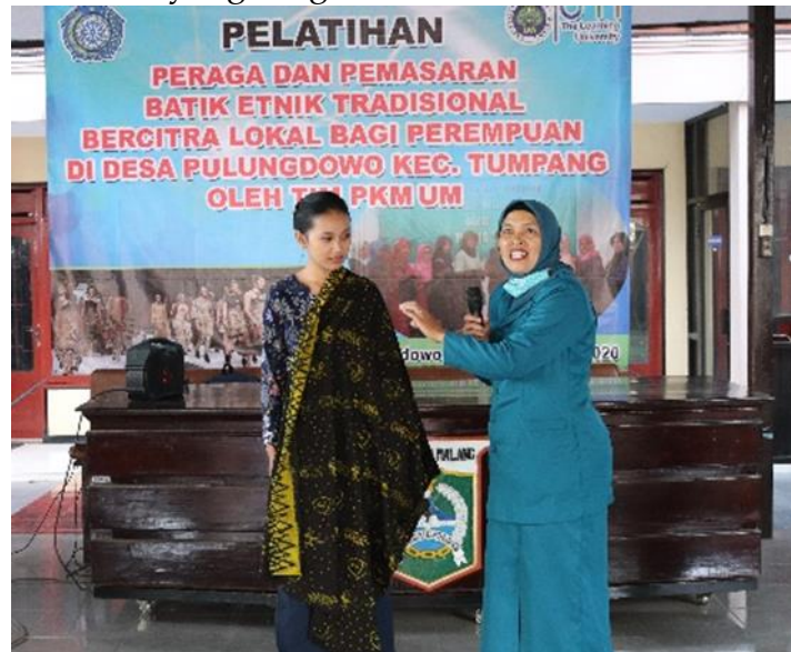
Gambar 5. Foto Aktivitas Peserta

bersifat praktis dan mampu dipraktikkan secara mudah. Maka program kegiatan pelatihan pemasaran dan promosi batik desa Pulungdowo dilakukan mendapatkan sambutan yang sangat baik.