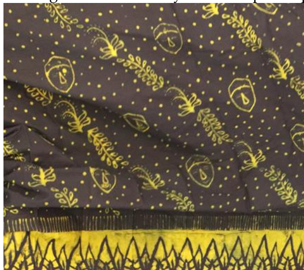
Gambar 2. Bentuk Desain Batik Khas Desa Pulungdowo

Perencanaan program pengembangan potensi perempuan desa Pulungdowo berdasarkan program unggulan desa, yaitu kerajinan batik tulis. Keunggulan ini disadari atas potensi lingkungan desa, yaitu (a) berada di lingkungan situs purbakala candi Kidal dan Jago. Serta adanya seni pertunjukan wayang topeng yang sudah berlangsung sejak awal abad XX (1920) (Hidajat 2005). Kesadaran potensi tersebut dipicu oleh Kegiatan Pengabdian Masyarakat tematik seni mahasiswa Universitas Negeri Malang. Mereka menggali pola yang memiliki kesesuaian dengan tema historis yaitu batik pola topeng.