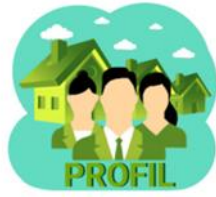
Gambar 6. Tampilan Thumbnail Profil dari Perancangan Website E-Government