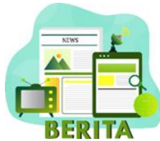
Gambar 7. Tampilan Thumbnail Berita dari Perancangan Website E-Government

Thumbnail ini berisikan keadaan, informasi pembangunan serta informasi kegiatan dan program desa yang akan disimpan dalam website untuk mempermudah masyarakat desa maupun luar mengetahui tentang Desa Tempursari lebih lanjut.