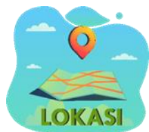
Gambar 9. Tampilan Thumbnail Galeri Lokasi dari Perancangan Website E-Government