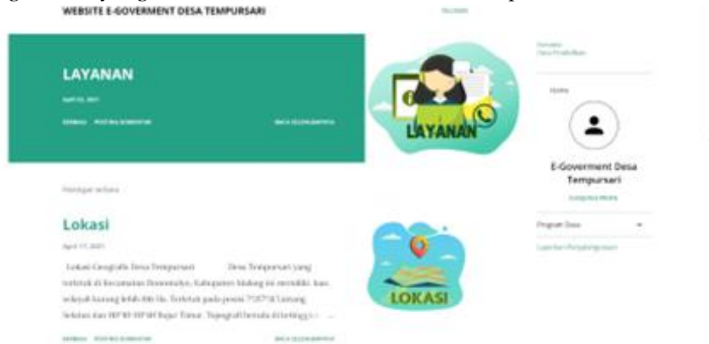
Gambar 4. Tampilan Halaman Utama dari Perancangan Website E-Government

Merupakan tampilan thumbnail yang berisikan informasi mengenai program desa dan sistem keuangan desa. Program desa ini nanti akan terhubung ke website desa yaitu website branding , serta informasi mengenai program kegiatan desa. Sedangkan untuk sistem keuangan desa merupakan informasi keuangan desa yang diambil dari website resmi desa dari pemerintah.