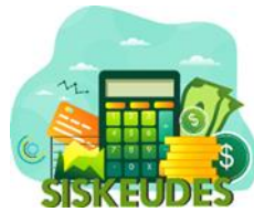
Gambar 10. Tampilan Thumbnail SISKEUDES dari Perancangan Website E-Government

SisKeuDes (Sistem Keuangan Desa) merupakan data informasi Desa Tempursari dalam upaya mengawal transparansi pengelolaan keuangan desa, BPKP bersama Kementerian Dalam Negeri membangun Aplikasi Siskeudes pada tahun 2015. Menurut survey BPKP pada tahun 2014, pengetahuan SDM perangkat desa sangat minim dalam hal keuangan desa, padahal uang yang harus dikelola di desa sangat banyak. Siskeudes adalah aplikasi gratis yang dapat menjadi solusi.