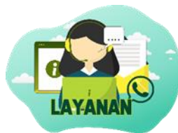
Gambar 5. Tampilan Thumbnail Layanan dari Perancangan Website E-Government

Merupakan sistem yang dibuat untuk mempermudah masyarakat desa untuk mendapatkan pelayanan lebih mudah. Layanan dibagi menjadi dua yaitu layanan publik dan layanan desa. Layanan publik yang disajikan berupa informasi mengenai kependudukan, kependidikan, kesehatan dan perizinan. Melainkan layanan desa untuk masyarakat menyajikan administrasi serta laporan pengaduan.