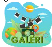
Gambar 8. Tampilan Thumbnail Galeri Foto dari Perancangan Website E-Government

Data ini akan berisikan dokumentasi berupa gambar visual tempat - tempat yang ada di Desa Tempursari serta akan terdapat tampilan google maps untuk memperlihatkan lokasi desa secara geografis, selain itu Desa Tempursari memiliki PETA maps yang terdapat di Balai Desa dimana data itu juga dimasukkan kedalam thumbnail galeri.