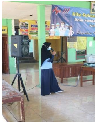
Gambar 2. Pembukaan acara