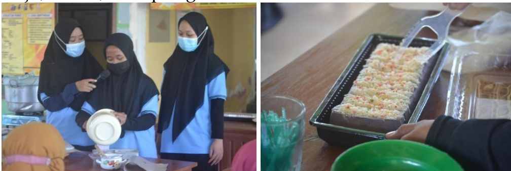
Gambar 5. Demosntrasi pembuatan brownies

Tahap yang terakhir dalam demonstrasi masak adalah praktik membuat “Gumun Brownies”. Terlebih dahulu pemandu masak menjelaskan terkait bahan dan alat yang akan digunakan. Para tamu undangan juga telah diberikan catatan tentang bagaimana proses pembuatan brownies nya, agar mereka mampu membuatnya kembali ketika di rumah. Brownies berhasil dibuat dengan berbagai topping, yakni ada keju, meses, dan springkel.