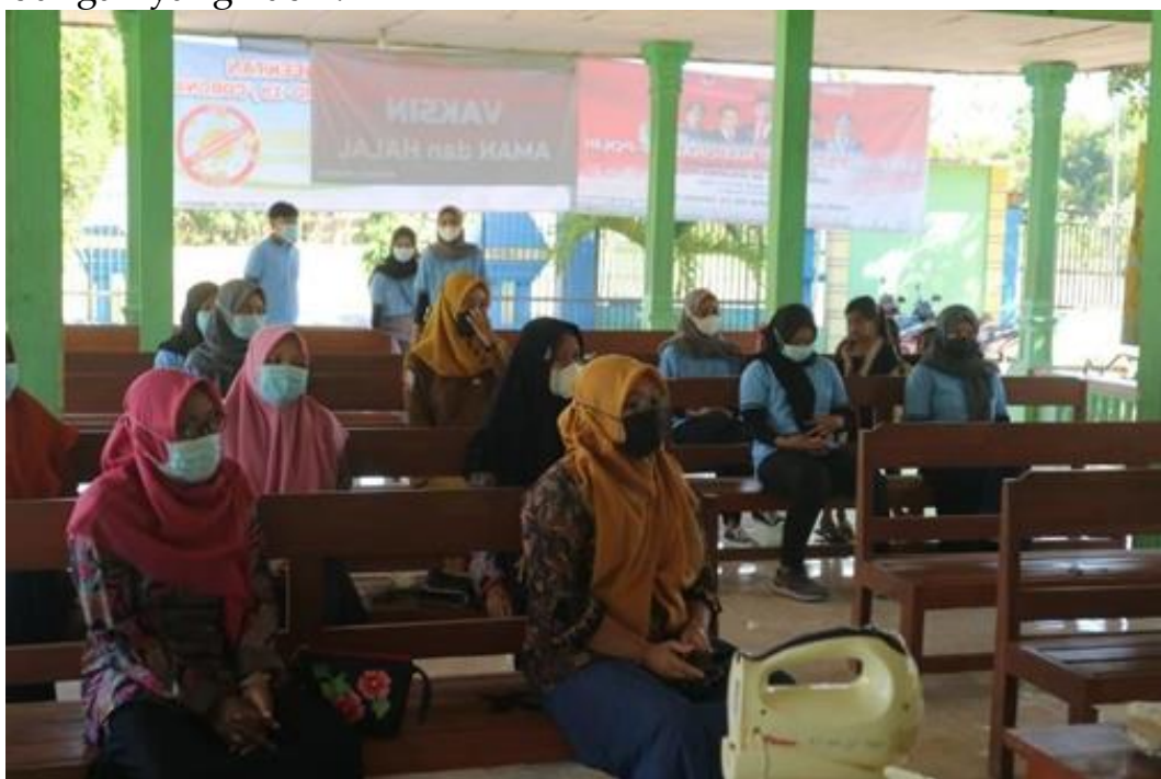
Gambar 1. Para tamu undangan

Kegiatan pengabdian masyarakat ini dilakukan dengan menyelenggarakan kegiatan demonstrasi masak yang dihadiri oleh perwakilan ibu PKK. Demonstrasi diselenggarakan di aula balai desa Sumbangtimun dengan di pandu secara langsung oleh salah satu peserta kegiatan pengabdian masyarakat Universitas Negeri Malang. Kegiatan berjalan dengan antusiasme yang sangat luar biasa dari berbagai tamu undangan yang hadir.