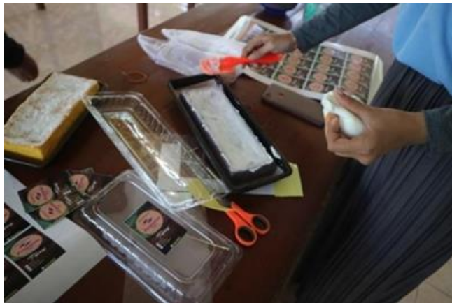
Gambar 4. Pengemasan brownies

Adapun untuk pengemasan “Gumun Brownies” ini dilakukan dengan mengemasnya pada wadah mika bening yang ukurannya sesuai dengan brownies yang telah dibuat. Sehingga, tanpa membuka pengemasannya konsumen sudah dapat melihat bagaimana bentuk brownies nya. Mufreni (2016) menyatakan bentuk kemasan sangat berpengaruh terhadap psikologis calon konsumen, dengan bentuk kemasan yang menarik dan terkesan besar akan membuat konsumen lebih tertarik membeli.