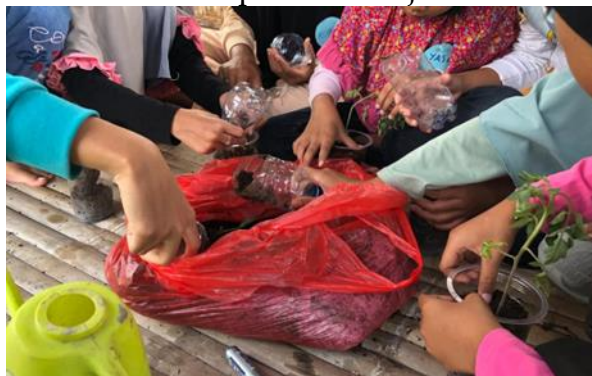
Gambar 7. Kegiatan menanam sayuran

Setelah kegiatan kolase daun usai, kegiatan selanjutnya adalah menanam sayuran, sayuran-sayuran ini sudah ditentukan dan disediakan oleh tim mahasiswa UM. Jenis sayuran tersebut masih dalam kondisi bibit, yang terdiri dari bibit cabai, tomat, brokoli, kol, dan terong. Kegiatan ini dibagi menjadi 3 kelompok, yang terdiri dari 10 hingga 9 anak-anak, dengan masing-masing terdapat pembimbing dari mahasiswa UM sebanyak 2 orang. Pembimbingan ini adalah untuk mengedukasi anak-anak cara menanam sayuran yang baik dan benar, mulai dari mengambil tanah yang dibutuhkan, jenis tanah yang cocok digunakan, kemudian menjelaskan fungsi dari setiap bagian-bagian tanaman, serta mengenalkan bibit sayuran kepada anak-anak sehingga anak-anak memahami tanaman yang menjadi potensi di desanya, dan selanjutnya cara menyiram yang baik dan benar serta bagaimana cara membesarkannya. Kegiatan menanam ini berlangsung sekitar 45 menit, setelah kegiatan menanam, anak-anak memberi nama pada bagian pot sebagai identitas penanamnya, untuk kemudian dikumpulkan menjadi satu untuk menuju kegiatan selanjutnya.