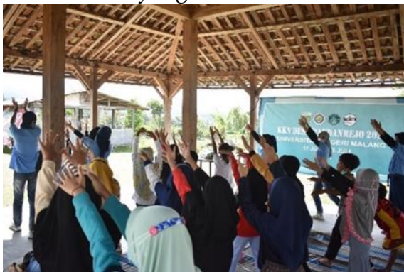
Gambar 4. Kegiatan apersepsi senam irama

Kegiatan saat acara diawali dengan kegiatan apersepsi berupa senam irama untuk meningkatkan semangat anak-anak yang diikuti sebanyak 28 anak, yang seluruhnya berasal dari Dusun Pandan. Kemudian pembagian kelompok sebanyak 5 kelompok untuk membuat kolase daun, setiap kelompok terdiri dari 5 hingga 6 anak. Kegiatan kolase daun ini merupakan kegiatan menempelkan daun kepada gambar yang sebelumnya sudah dibuat oleh tim mahasiswa UM, sehingga daun-daun yang dipotong akan berbentuk mozaik yang mengikuti gambar dan dilem menggunakan lem kayu, setiap kelompok terdapat pendamping yang berasal dari tim mahasiswa UM, tenggat waktu yang diberikan 1 jam dengan di sela-sela pendampingan kami juga mengedukasi kepada anak-anak mengenai jenis-jenis tulang daun, fungsi daun, dan fakta menarik tentang daun. Kemudian hasil karya anak-anak tersebut dikumpulkan menjadi satu untuk kemudian direkapitulasi untuk ditentukan karya terbaik sejumlah 3 anak yang diberikan hadiah atau reward sebagai bentuk apresiasi.