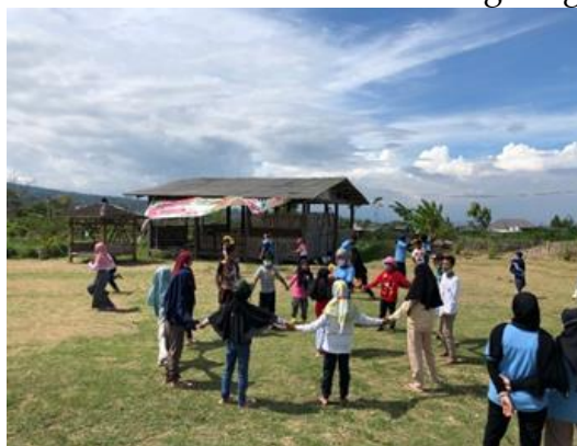
Gambar 10. Kegiatan setelah menentukan nama

Berdasarkan hasil pengamatan kami, anak-anak sangat antusias dengan kegiatan ini, selain itu dengan kegiatan permainan ini anak-anak menjadi lebih mengenal satu sama lain, tingkat sosialisasi anak meningkat diharapkan ketergantungan anak-anak terhadap smartphone lebih berkurang dan memiliki kesadaran akan melestarikan lingkungan sekitarnya, serta peduli dengan sesama.