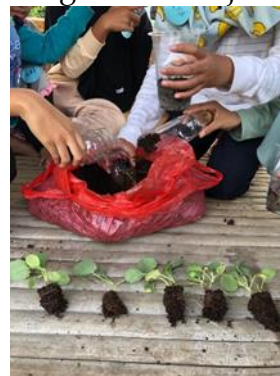
Gambar 8. Salah satu jenis bibit sayuran yang digunakan