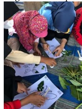
Gambar 5. kegiatan kolase daun