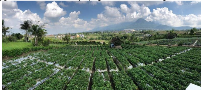
Gambar 1. Lanskap Perkebunan Stroberi di Desa Pandanrejo

Desa Pandanrejo memiliki potensi yang cukup tinggi terutama dalam hal perkebunan dan pariwisata, hal ini dilihat dalam kajian toponimi dari masing-masing dusun yang digambarkan sebuah kawasan yang subur yang banyak tumbuh tumbuh-tumbuhan dan juga memiliki aliran sungai dan sumber mata air. Desa Pandanrejo memiliki luas wilayah 6.626 km 2 , di mana mayoritas wilayah di Desa Pandanrejo berupa perkebunan. Perkebunan yang menjadi komoditas utama adalah perkebunan Stroberi, Murbei, dan Sayuran. Perkebunan stroberi di Desa Pandanrejo sendiri menjadi identitas dari Desa Pandanrejo, sehingga perkebunan stroberi terus dikembangkan oleh pemerintah daerah setempat. Selain dalam sektor perkebunan, pemerintah desa Bersama dengan pemerintah kota batu mengembangkan produk UMKM olahan Stroberi, yaitu Minuman Stroberi, sehingga banyak warga Desa Pandanrejo yang bermatapencaharian di industri rumahan (Lobo, 2020). Selain itu juga dikembangkan pula dalam sektor pariwisata, baik berupa wisata alam dan buatan, sehingga Desa Pandanrejo juga disebut sebagai desa wisata.