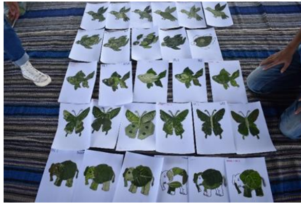
Gambar 6. Hasil dari kolase daun