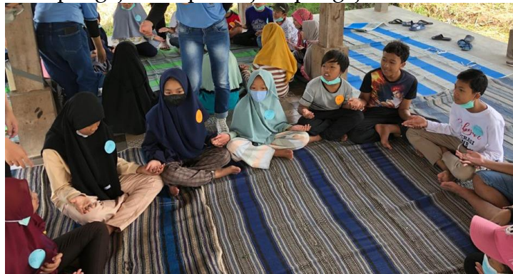
Gambar 9. Bernyanyi dan menentukan nama pada awal permainan kotak pos

anak sehingga semangat anak-anak untuk mengikuti seluruh rangkaian kegiatan tetap terjaga. Kegiatan ini sama seperti desain permainan sebelumnya yakni melingkar di setiap kelompoknya masing-masing sehingga terdapat 3 lingkaran, untuk menentukan nama setiap anggota dengan bernyanyi. Setelah bernyanyi dan menentukan identitas dari masing-masing anak-anak maka, anak-anak ke tanah yang lapang, pada bagian ini anak-anak sangat antusias. Setelah ditentukan siapa yang menjadi pengejar dari temannya, maka pengejar harus mengejar anggota yang lain, ketika sudah tertangkap maka harus menyebutkan nama yang ditangkap, apabila benar maka yang tertangkap menjadi pengejar, apabila salah maka pengejar tetap menjadi pengejar.