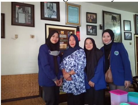
Gambar 2. Berkoordinasi dengan Ibu Kepala Desa Pandanrejo

Pelaksanaan kegiatan dari Sekolah Alam terbagi menjadi tiga tahapan, yaitu pra-acara, saat acara, dan pasca-acara. Kegiatan pra-acara adalah kegiatan persiapan untuk pelaksanaan kegiatan acara, kegiatan pra-acara diawali dengan berkoordinasi dengan ibu Kepala Desa Pandanrejo selaku ketua PKK Desa Pandanrejo, sehingga kami lebih mengetahui lokasi yang cocok untuk digunakan program kerja Sekolah Alam ini serta dapat berhubungan dengan anak-anak yang ada di lokasi. Setelah berkoordinasi dengan dengan ibu Kepala Desa Pandanrejo, kegiatan di pra-acara dilanjutkan dengan berkoordinasi dengan Ketua Pokja 1 Desa Pandanrejo Ibu Fauziah untuk bisa berkoordinasi dengan anak-anak sasaran dan dilanjutkan dengan mengurus perizinan tempat yaitu di Lumbung Strawberry Dusun Pandan.