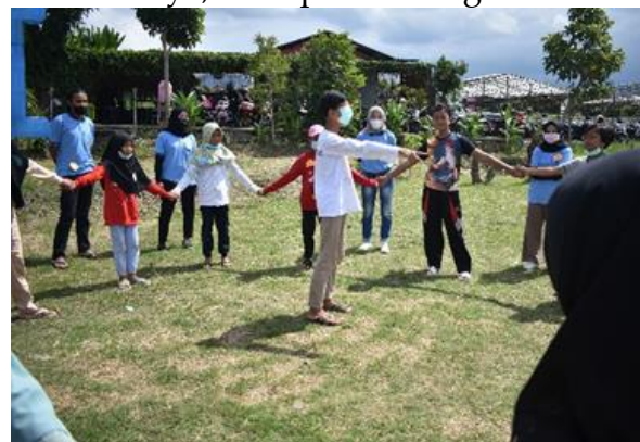
Gambar 11. Yang menjadi pengejar berada di tengah lingkaran