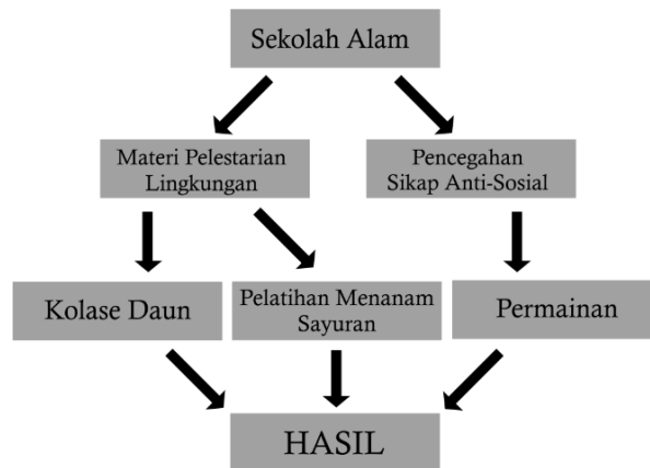
Diagram 2. Desain Kegiatan Sekolah Alam