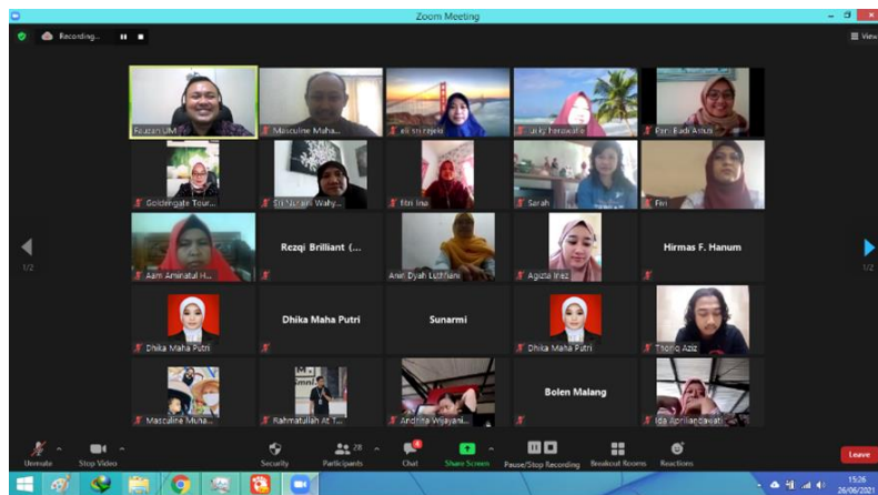
Gambar 3. Sosialisasi Aplikasi Lamikro secara Daring (On- line)