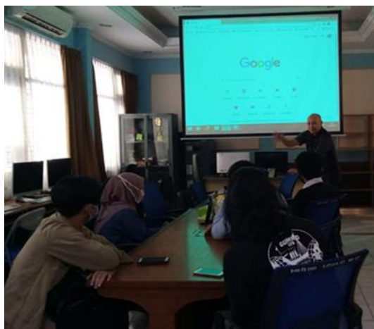
Gambar 4. Pelatihan Fasilitator secara Luring