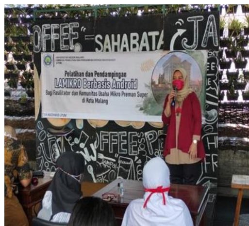
Gambar 5. Pelatihan Mitra secara Luring