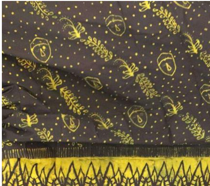
Gambar 2. Bentuk desain batik khas desa Pulungdowo

berlangsung sejak awal abad XX (1920). Kesadaran potensi tersebut dipicu oleh Kegiatan Pengabdian tematik seni mahasiswa Universitas Negeri Malang. Mereka menggali pola yang memiliki kesesuaian dengan tema historis yaitu batik pola topeng.