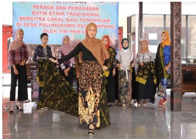
Gambar 4. Penampilan tampilan fashion show peserta secara bergantian

Hal ini menunjukkan adanya peningkatan yang signifikan dari semula peserta yang hanya mengetahui dan mendengar secara tidak langsung tentang pemasaran dan promosi produk. Kini mereka dengan mantap secara meyakinkan telah memahami dan bersedia untuk mencoba melakukan kegiatan pemasaran produk unggulan desa Pulungdowo.