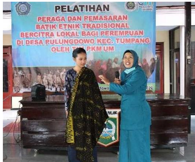
Gambar 5. Foto aktivitas peserta

Hasil evaluasi menunjukkan adanya peningkatan pengetahuan lebih dari 90%, atau 15 peserta yang mempunyai nilai rata rata sangat memuaskan, dan 10 % memuaskan. Sehingga penilaian tim pengembangan pengabdian masyarakat universitas Negeri Malang menyatakan kegiatan ini secara signifikan berhasil.