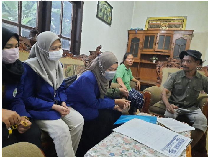
Gambar 2. Pendampingan Pembukaan

Pada kunjungan pertama, mahasiswa melakukan identifikasi transaksi-transaksi yang secara umum terjadi di UMKM tersebut serta mengetahui kendala UMKM dalam melakukan pembukuan, di mana sebagian besar kendala yang dihadapi adalah berupa kendala waktu. Padatnya kegiatan sehari-hari serta kurangnya tenaga kerja yang memahami keuangan menjadikan UMKM tidak melakukan pembukuan. Untuk itu, mahasiswa memberikan model pembukuan yang sederhana, terdiri dari Buku Kas, Buku Penjualan, dan Buku Pembelian. Setelah melakukan kunjungan pertama, mahasiswa MBKM-Membangun Desa Gedog Wetan melakukan materi pendampingan yang dibutuhkan, yakni format laporan yang sesuai dengan UMKM.