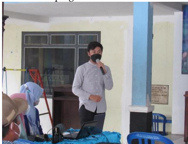
Gambar 1. Sosialisasi Pembukaan

Langkah awal yang dilakukan oleh mahasiswa dalam pelaksanaan kegiatan Pendampingan Pembukuan UMKM adalah mengenali jenis usaha UMKM pada Desa Gedog Wetan, Kecamatan Turen, Kabupaten Malang. Setelah itu, mahasiswa melakukan sosialisasi terkait pentingnya pembukuan dalam keberlangsungan suatu usaha. Pada akhir acara tersebut, mahasiswa memberikan penawaran kepada tamu undangan atau pemilik UMKM untuk berpartisipasi dalam Pendampingan Pembukuan UMKM.