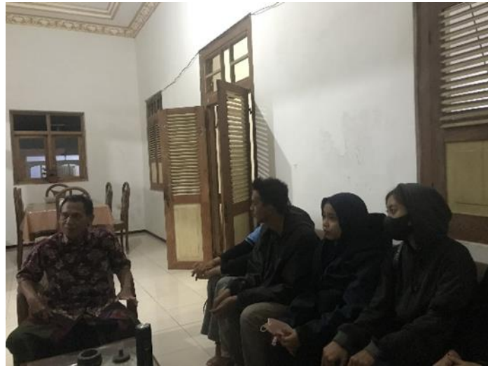
Gambar 2. Koordinasi bersama pelaku kesenian

Tahap awal yang dilakukan yaitu melaksanakan pendekatan dengan target sasaran mengenai sejarah kesenian di Desa Pagelaran dan kegiatan kesenian apa saja yang terdapat di kampung budaya. Tim PkM melakukan koordinasi dengan pihak-pihak terkait.