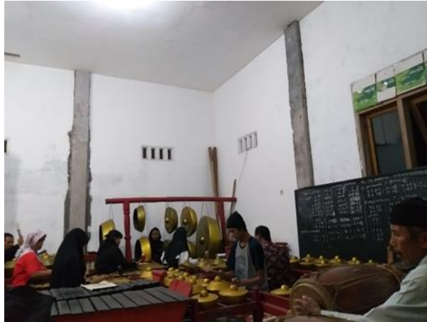
Gambar 4. Latihan Karawitan

mendokumentasikan sebagai bahan pemasaran digital. Berdasarkan pengamatan, warga yang mengikuti karawitan berasal dari beragam usia. Hal ini menunjukkan bahwa minat pemuda desa sangat tinggi untuk melestarikan budaya karawitan.