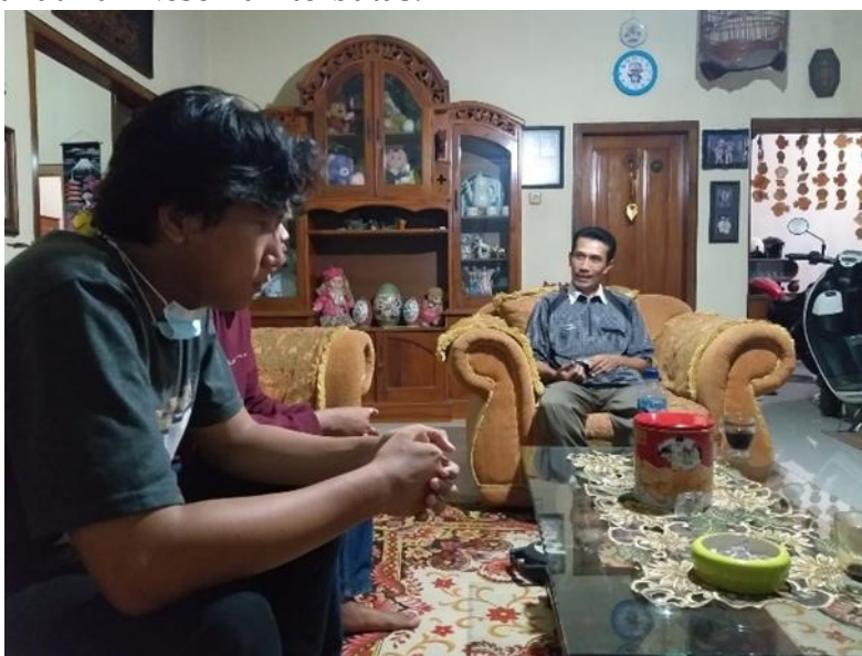
Gambar 3. Koordinasi bersama warga

Pada tahap perencanaan, dilakukan analisis dari data dan informasi yang diperoleh dari tahap perencanaan untuk menentukan langkah-langkah yang akan dilaksanakan. Serta melakukan wawancara terlebih dahulu. Dari tahap ini diperoleh informasi bahwa sebelum pandemi covid-19 pagelaran kesenian yang diadakan selalu ramai pengunjung baik dari warga desa maupun warga luar desa, masyarakat kampung budaya juga sering melaksanakan pagelaran di luar desa. Sejak pandemi covid-19 segala aktivitas yang berkaitan dengan acara berpotensi berkerumun ditiadakan hingga pagelaran terhenti sementara. Saat ini kegiatan kesenian di kampung budaya mulai bangkit perlahan dengan diadakannya latihan kesenian terbatas.