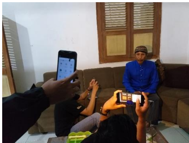
Gambar 5. Pengambilan video bersama pelaku kesenian

Warga yang mengikuti latihan karawitan sangat antusias selama kegiatan dan menghendaki kunjungan selanjutnya dari tim PkM. Setelah pelaksanaan kegiatan selesai, sesepuh desa melaksanakan pengambilan video berupa pesan untuk generasi selanjutnya agar tetap melestarikan budaya bangsa.