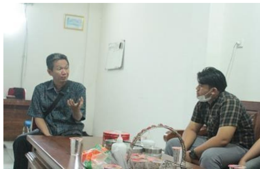
Gambar 2. Observasi dengan Perangkat Kelurahan

Dalam tahap awal kegiatan Pendampingan Persiapan Kelurahan Kampung Dalem Kota Kediri menuju kampung KEREN dilakukan pencarian data awal yang berkaitan dengan kondisi umum kampung dan permasalahan ataupun kebutuhan dari masyarakat di kampung tersebut melalui observasi dan wawancara kepada masyarakat Kampung Dalem. Kegiatan ini berlangsung selama 4 hari dimulai dari tanggal 29 Juni – 2 Juli 2022 dengan mengamati secara langsung bagaimana cara masyarakat Kelurahan Kampung Dalem dalam menyambut wisatawan yang berkunjung dan kesiapan masyarakatnya dalam menyambut Kampung Keren (Kreatif dan Independen). Kemudian, ketika data sudah terkumpul maka tim di Kampung Dalem melakukan koordinasi dengan stakeholder Kelurahan Kampung Dalem guna menyamakan persepsi dan menyepakati maksud dan tujuan, sasaran, materi, strategi, dan jadwal pendampingan.