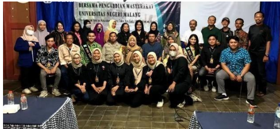
Gambar 5. Foto Bersama tim pengabdian, narasumber, dan para peserta pelatihan

KEREN (Kreatif Independen). Sebagai kampung yang mengusung keunggulan pariwisata, khususnya di wisata edukasi dan kuliner, tata cara penyambutan tamu harus menjadi perhatian utama agar pengunjung mendapatkan pengalaman serta kesan yang baik. Tujuan akhir yang diharapkan dari pendampingan hospitality adalah untuk membentuk kesiapan masyarakat dalam menyambut kampung KEREN di Kelurahan Kampung Dalem Kec., Kab. Kota Kediri, untuk menambah pengetahuan masyarakat tentang tata cara dan manner yang baik dalam menerima dan melayani tamu.