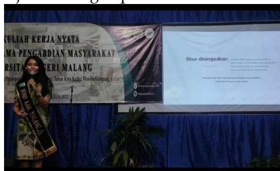
Gambar 4. Penjelasan manner kunjungan wisata oleh Roro Judith

Pelatihan hospitality lebih banyak disampaikan oleh pemateri kedua yaitu Roro Judith. Roro Judith juga mempraktikkan bagaimana body language dan juga gestur tubuh yang baik Ketika menyambut para tamu. Di akhir, Judith memberikan kesimpulan bahwa manner yang baik akan meninggalkan kesan yang baik pula untuk sebuah destinasi pariwisata. Para masyarakat penting untuk mulai belajar bagaimana tata cara penyambutan serta menjamu para pengunjung agar kesan tersebut dapat menciptakan image yang baik dari sebuah destinasi. Di akhir, para peserta diberikan kesempatan untuk mempraktikkan tata cara penyambutan tamu yang benar serta diberikan wadah untuk melakukan sesi tanya jawab dengan para narasumber.