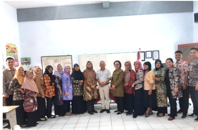
Gambar 2. Kegiatan Foto Bersama Peserta Pengabdian