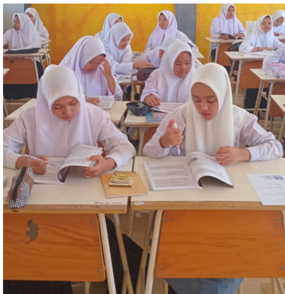
Gambar 1. Literasi Keuangan di Kelas

pengetahuan memadai tentang bagaimana mengelola uang dan meminjam secara bertanggung jawab. Hal ini menunjukkan bahwa literasi keuangan perlu diajarkan sejak usia dini, terutama di era digital di mana layanan keuangan seperti pinjaman online mudah diakses.