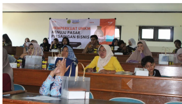
Gambar 3: Pelaku UMKM menyimak penyampaian mater

beramal. Hal ini sesuatu hal yang perlu dibantah atau salah, memang pada kenyataannya manfaat pajak tidak dirasakan secara langsung atau terang-terangan. Mayoritas UMKM menjadi wajib pajak yang kurang taat akan pajak (Putra, 2020). Berdasarkan penyampaian peserta diketahui bahwa pelaku UMKM berfikir bahwa mencari untung saja sudah sulit, untuk bertahan dan bertumbuh saja sudah mati-matian tetapi mengapa masih harus dibebani oleh pembayaran pajak. Dari pernyataan inilah narasumber mulai memberikan penjelasan dengan kalimat sederhana yang mana tetap dikemas dengan baik agar kehadiran pajak sudah tidak lagi dianggap momok oleh beberapa pelaku usaha. Gambar 3 menunjukkan kehadiran peserta pelaku UMKM.