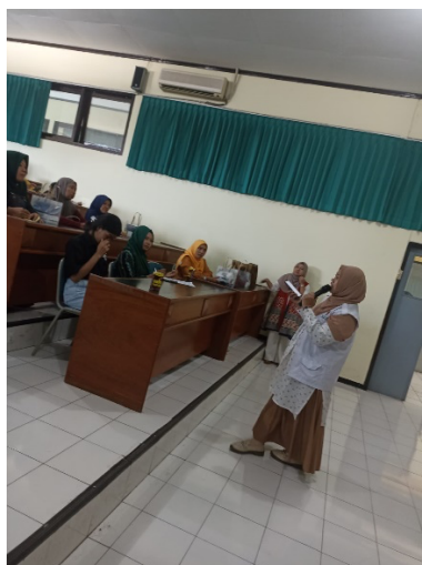
Gambar 1: Ketua Baznas memberikan sambutan

pengurus Baznas terlihat pada gambar 1 dan juga kaprodi D3 Akuntansi. Kolaborasi dilakukan untuk menunjukkan adanya sinergi ilmu akademik dan juga secara praktik. Pada sambutan yang diberikan oleh Baznas dijelaskan bahwasannya Bznas berperan dalam memberikan perspektif mengenai pentingnya kepatuhan perpajakan sebagai salah satu pilar dalam mendukung ekonomi umat, sedangkan Ketua Program Studi D3 Akuntansi memfasilitasi materi teknis terkait tata cara pendaftaran Nomor Pokok Wajib Pajak (NPWP) serta manajemen keuangan dasar bagi UMKM.