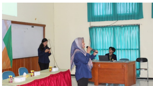
Gambar 2: Dosen memberikan penjelasan terkait manfaat pajak

Materi yang diberikan di awal adalah pengenalan terkait apa itu pajak. Pemateri yang merupakan dosen pajak Universitas Merdeka Malang juga berprofesi sebagai konsultan jadi memahami betul bagaimana Gap antara UMKM dengan pajak. Pada materi yang disampaikan dengan bahasa luwes untuk menghindari kecenderungan keberpihakan dengan pajak. Gambar 2 menunjukkan dosen memberikan penjelasan kepada pelaku UMKM tentang alasan pajak selalu ada dan tidak akan lepas dari dunia usaha.