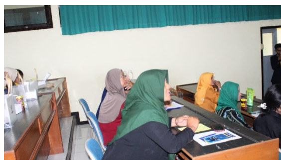
Gambar 5: Peserta bertanya terkait materi

Diskusi menjadi lebih interaktif ketika beberapa peserta mulai tergugah akan pentingnya serta manfaat kepemilikan Nomor Pokok Wajib Pajak (NPWP). Ketertarikan peserta semakin meningkat ketika muncul pertanyaan tentang bagaimana kewajiban pajak setelah memiliki NPWP, terutama terkait kekhawatiran jika mereka harus membayar pajak meskipun keuntungan usaha masih belum signifikan. Gambar 5 menunjukkan antusiasme peserta yang bertanya. Pada titik ini, pemateri menjelaskan lebih lanjut bahwa tidak semua pemilik NPWP wajib membayar pajak. Pemateri menekankan bahwa selama keuntungan usaha belum mencapai ambang batas penghasilan kena pajak, pelaku usaha hanya diwajibkan untuk melaporkan pajak, tanpa harus membayar pajak. Hal ini membantu meredakan kekhawatiran peserta bahwa pajak akan membebani mereka secara langsung tanpa mempertimbangkan besarnya keuntungan yang diperoleh.