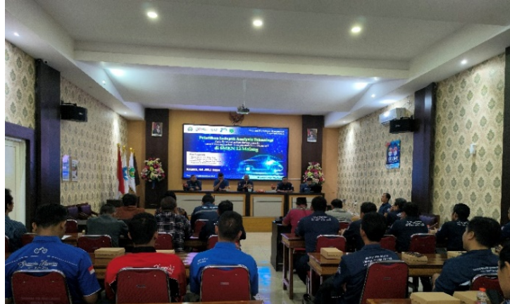
Gambar 2: Acara pembukaan serta sambutan

MGMP Otomotif Kota Malang, Besar Abadi Prayogi, S.T. Dalam sambutannya, Drs. Suryanto menekankan pentingnya pelatihan ini untuk membekali para guru dengan keterampilan yang dibutuhkan di masa depan, khususnya di bidang teknologi kendaraan listrik.