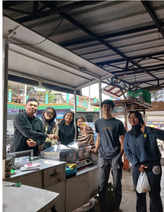
Gambar 2: Dokumentasi survei awal di umkm dimsum bara bere patrol

Tahap awal dalam kegiatan ini adalah melakukan survei terhadap kondisi pencatatan keuangan yang telah diterapkan oleh UMKM Dimsum Bara Bere pada tanggal 6 Maret 2025. Survei ini dilakukan dengan mewawancarai pemilik usaha untuk mengetahui bagaimana mereka mencatat pemasukan dan pengeluaran sehari-hari, serta tantangan yang mereka hadapi dalam mengelola keuangan bisnis.