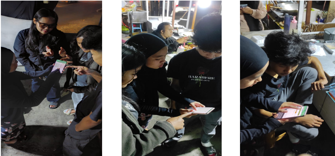
Gambar 4: Proses pendampingan penerapan sistem pencatatan keluar masuk uang berbasis microsoft excel

Sebagai bagian dari penerapan sistem ini, dilakukan pendampingan langsung untuk memastikan pemilik usaha dapat menggunakan Excel dengan lancar.