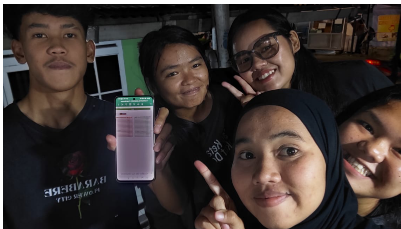
Gambar 5: Penggunaan sistem excel oleh pelaku Bisnis umkm dimsum bara-bere