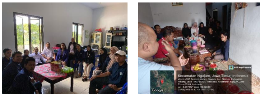
Gambar 1. Observasi

Tahap observasi dilakukan melalui beberapa pertemuan penting bertujuan untuk memetakan permasalahan dan mencari solusi bersama. Hasil observasi menunjukkan adanya dukungan dari masyarakat dan kepala desa untuk keberhasilan program. Beberapa pertemuan tersebut yaitu