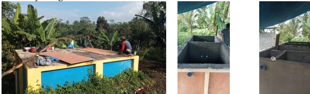
Gambar 3. Proses Pembuatan Tandon