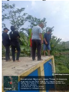
Gambar 2. Survei Lokasi

Dilakukan pada tanggal 3 mei 2025 yaitu melakukan survei lapangan ke lokasi sumber mata air dan penampungan utama. Hasil yang disepakati mengenai lokasi pembangunan tandon air penyaringan.