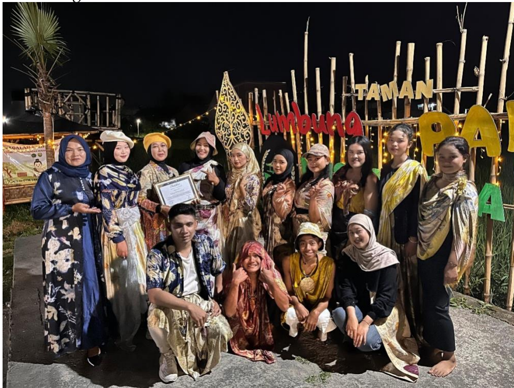
Gambar 3. Kegiatan Fashion Show Hari Anak Nasional

Pelaksanaan kegiatan Fashion Show Hari Anak Desa Kejawanan dilakukan melalui serangkaian Langkah yang diawali dengan koordinasi bersama pemerintah desa dan pembentukan panitia internal mahasiswa KKN, kemudian dilanjutkan dengan pembuatan dan penyediaan kain batik dan ecoprint yang akan digunakan sebagai busana peserta. Selama proses berlangsung, dilakukan pelatihan sederhana kepada anak dan remaja peserta fashion show mengenai cara berjalan di runway dan penjelasan tentang makna dan motif batik yang dikenakan. Promosi acara dilakukan melalui pampflet, pemberitahuan langsung kepada warga, serta publikasi media sosial. Pada hari pelaksanaan, peserta fashion show tampil memperagakan kain bati