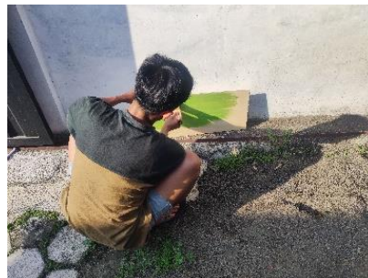
Gambar 2. Proses Pembuatan Plang Arah

Pembuatan plang arah, material yang digunakan adalah papan kayu berukuran 50 x 30 x 0.3 cm dengan tinggi tiang ± 1.5 M. tiang kayu dicapkan dibeton dengan cetakan gallon bekas. Tujuan penancapan ini agar plang bisa tetap berdiri kokoh.