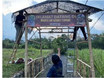
Gambar 8. Pemasangan Banner Sambutan