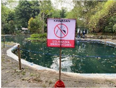
Gambar 7. Banner Himbauan