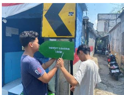
Gambar 3. Proses Pemasangan Plang Arah 150m

Plang penunjuk arah dipasang di dua titik yaitu di selatan Wendit Lanang tepatnya di dusun Wendit Utara dekat patung singa dengan jarak 150m dari lokasi Wendit Lanang. Yang ke 2 yaitu terletak di desa Tirtomoyo yang berjarak 500m. penentuan dua titik plang arah ini berdasarkan potensi banyaknya pengendara atau masyarakat yang mengakses jalan tersebut. Seperti penempatan di Wendit utara dengan pertimbangan jangkauan pengendara ramai dari arah selatan maun utara, sedangkan di Desa Tirtomoyo pertimbangan akses jalan ramai dari arah Singosari sehingga potensi Wisata Wendit Lanang bisa dikenal masyarakat luas.