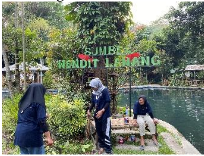
Gambar 5. Proses Pembersihan dan Pengecatan Spot Foto

kegiatan ini meliputi pemberisihan tanaman dan ranting pohon yang menutupi papan nama, perapian juga dilakukan agar tanaman dibawah tulisan tersebut terlihat rapi dan selanjutnya melakukan pengecatan. Pembersihan ini bertujuan memperindah area wisata sehingga menarik minat wisatawan. Spot foto Wisata Wendit Lanang terletak diantara dua kolam yaitu kolam untuk orang dewasa dan kolam untuk anak anak. Posisi spot foto ini berada di ditengah dengan akses jalan paving. Background foto langsung menghadap ke kolam dengan adanya pohon rindang dan tanaman-tanaman disekitarnya.