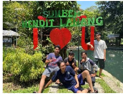
Gambar 6. Hasil Setelah Pengecatan dan Pembersihan