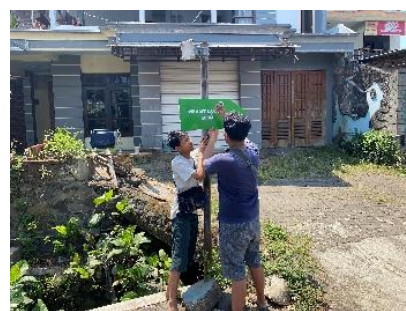
Gambar 4. Proses Pemasangan Plang Arah 500m