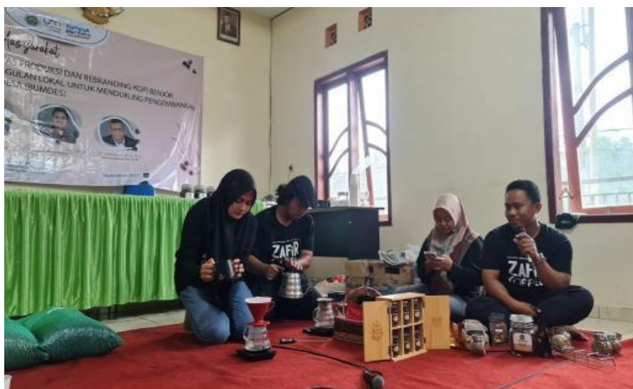
Gambar 2. Praktik pengolahan dan penyajian kopi

Menurut Korten mengemukakan ada 5 generasi strategi pemberdayaan. Pertama, generasi yang mengutamakan relief and welfare. Yaitu strategi yang mengutamakan kemandirian untuk memenuhi kebutuhan kehidupan sehari-hari atau kesejahteraan. Kedua, strategi community development, yang lebih mengutamakan pada proses pengembangan masyarakat untuk memenuhi kebutuhan kesehatan, pangan, pendidikan, infrastruktur dan sebagainya. Ketiga, adalah generasi sustainable system development, yaitu mengharapkan terjadi perubahan-perubahan kebijakan utamanya yang terkait dengan pembangunan yang terlalu eksploitatif dan mengabaikan keberlanjutan pembangunan. Keempat, generasi mengembangkan gerakan masyarakat atau people movement, melalui pengorganisasian masyarakat, identifikasi masalah dan kebutuhan, mobilisasi sumber daya yang ada dan dapat dimanfaatkan dalam pembangunan. Kelima, generasi pemberdayaan masyarakat atau empowering people, yaitu generasi yang memperjuangkan ruang gerak yang lebih terbuka terhadap kemampuan dan keberanian masyarakat dan pengakuan penguasa atas inisiatif masyarakat (Mardi, 2018).