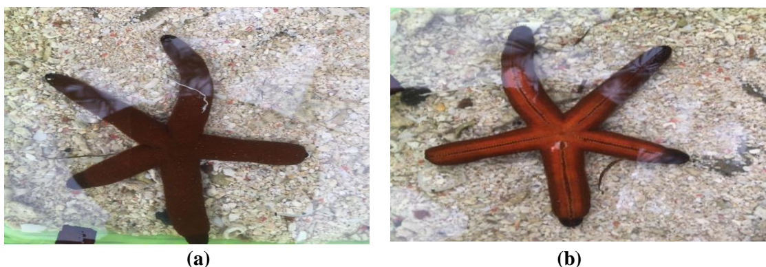
Gambar 3. Bintang Laut Spinulosida sp. (a) Bagian Aboral (b) Bagian Oral