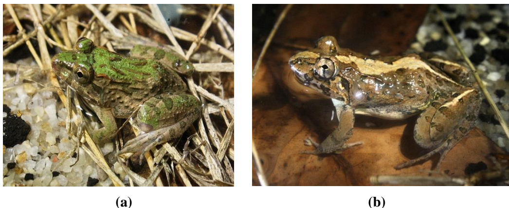
Gambar 1. Perbedaan katak sawah Fejervarya cancrivora (a) dan Fejervarya limnocharis (b)

Pengambilan sampel katak dilakukan dengan teknik purposive sampling dimana keberadaan masing-masing individu jenis Fejervarya diidentifikasi, dicatat, dan kemudian dihitung keberadaannya berdasarkan waktu saat ditemukan. Identifikasi jenis dilakukan dengan melihat karakter morfologi yang tampak pada kedua jenis Fejervarya tersebut.