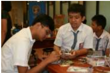
Gambar 3. Contoh Gambar dengan Resolusi Cukup