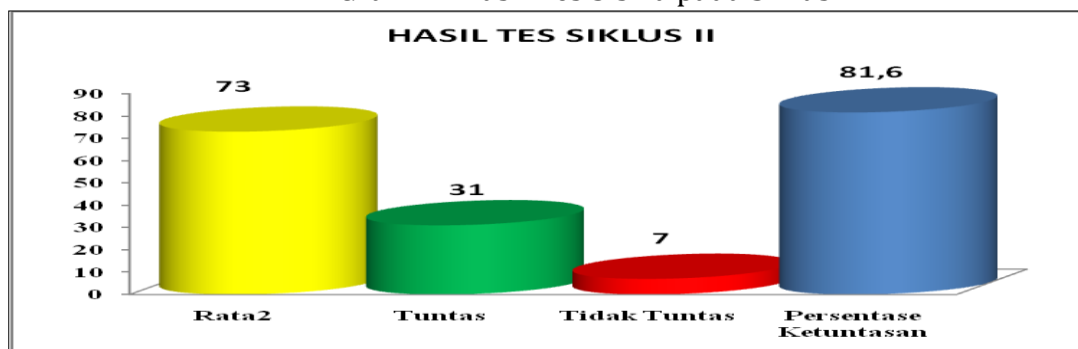
Grafik 2. Hasil Tes Siswa pada Siklus II

Dari tabel tersebut diperoleh nilai rata-rata prestasi belajar siswa adalah 73,0 dan ketuntasan belajar mencapai 81,6% atau ada 31 siswa dari 38 siswa sudah tuntas belajar. Hasil tersebut menunjukkan bahwa pada siklus II ini ketuntasan belajar secara klasikal telah mengalami peningkatan dibandingkan dengan siklus I. Adanya peningkatan hasil belajar siswa itu karena guru menginformasikan bahwa setiap akhir pelajaran akan selalu diadakan tes sehingga pada pertemuan berikutnya siswa lebih termotivasi untuk belajar. Selain itu, siswa juga sudah mulai mengerti apa yang dimaksudkan dan