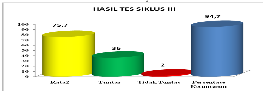
Grafik 3. Hasil tes Siswa pada Siklus III

Berdasarkan tabel tersebut diperoleh nilai rata-rata tes sebesar 75,7