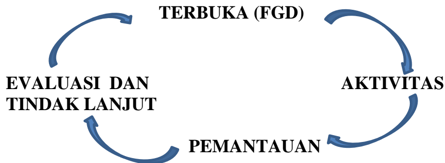
Gambar 1, Gambar siklus manajemen TAPE

belajar, membantu penyelidikan mandiri dan kelompok, mengembangkan dan menyajikan hasil karya serta menganalisis dan mengevaluasi proses pemecahan masalah (Mohamad Nur dalam Rusmono, 2012). Diagram penerapan manajemen TAPE untuk meningkatkan kemampuan guru menerapkan Problem Based Learning dalam pembelajarannya adalah sebagai berikut: