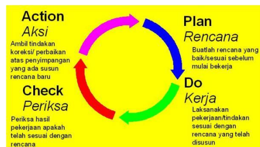
Gambar Siklus PDCA

Siklus APDCAA adalah siklus PDCA yang selalu di awal siklus berniat karena Allah SWT dan diakhir siklus pasrah pada takdir Allah SWT.