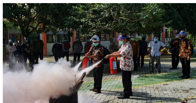
Gambar 5. Peserta melakukan Demonstrasi Pemadaman Kebakaran menggunakan APAR

Adapun manfaat pengembangan karir bagi karyawan/pegawai menurut Panggabean (2004) adalah dapat: (a) mengembangkan potensi diri dengan sepenuhnya, (b) menambah tantangan dalam bekerja, (c) meningkatkan rasa percaya diri, (d) meningkatkan rasa tanggung jawab, dan (e) secara tidak langsung akan meningkatkan kesejahteraan akibat keterampilan dan kompetensi yang dimiliki.