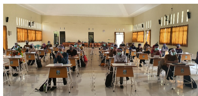
Gambar 2. Peserta Pelatihan