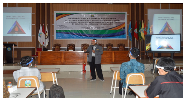
Gambar 1. Penyampaian Materi APAR oleh Tim Pelaksana Pengabdian

Kegiatan diawali dengan pembukaan yang dilakukan oleh Kepala Cabang Dinas Pendidikan Wilayah Tulungagung dan Trenggalek dan dilanjutkan dengan penyampaian materi oleh para nara sumber. Nampak dalam Gambar Ketua Tim satuan tugas pengabdian kepada masyarakat memberikan sambutan dan dilanjutkan dengan pemberian materi tentang teknik mengelola bengkel/laboratorium pendidikan di sekolah menengah kejuruan.