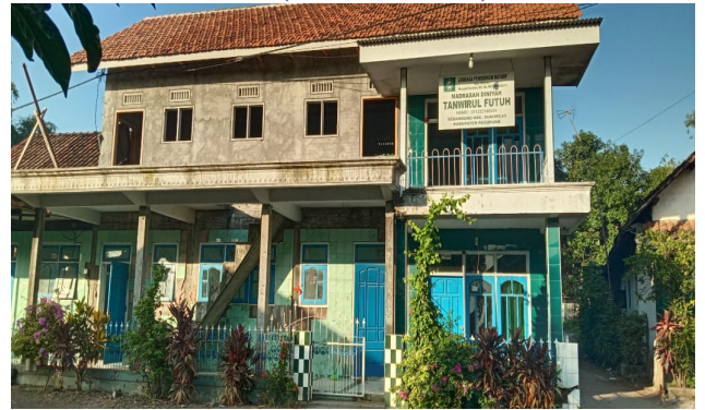
Gambar 2. Kondisi Madrasah Diniyah Tanwirul Futuh

Berikut pelaksanaan kegiatan dapat dilihat dari dokumentasi berikut (lihat Gambar 2).