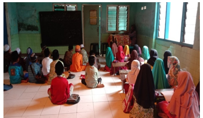
Gambar 2. Pendampingan Guru Madin selama Proses Pembelajaran