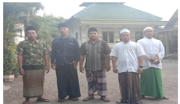
Gambar 3. Guru Madin Tanwirul Futuh

Dampak dari Kegiatan Pengabdian masyarakat ini cukup mendapatkan respon positif dari yayasan Tanwirul Futuh, karena kegiatan ini setidaknya akan menambah wawasan dan meningkatkan kompetensi guru madin dalam pembelajaran bahasa arab, guru yang awalnya di mengerti metode dan strategi pembelajaran menjadi mengerti dan meningkatkan kesadaran akan pentingnya sebuah metode dalam setiap kali melakukan proses pembelajaran.