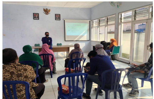
Gambar 4. Pelatihan Penggunaan dan Perawatan Alat

Selain telah dibuatnya mesin kristalisasi dengan kapasitas 15 kg, dalam program pengabdian masyarakat ini juga telah melaksanakan pelatihan dalam penggunaan dan perawatan alat untuk menjaga keawetan dari alat kristalisasi nantinya jika digunakan untuk produksi dalam sehari-hari. Dalam pelatihan yang dilakukan, mitra sangat antusias dan dapat memahami materi yang disampaikan dengan baik, yang dibuktikan dengan mampunya mitra dalam mengoperasikan mesin kristalisasi tersebut (lihat Gambar 4).