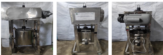
Gambar 3 . Mesin Kristalisasi Tampak Depan Tampak Kiri dan Tampak Belakang

Setelah dilaksanakannya program kerja kami yaitu Pembuatan Mesin Kristalisasi Bagi Kelompok Usaha Mikro Kecil Menengah (UMKM) Melati Losari yang bertujuan untuk meningkatkan proses produksi minuman jahe herbal instan dengan kapasitas yang lebih besar yaitu 15 kg dan mengefisiensi waktu dalam proses produksi minuman jahe UMKM Melati Losari dinyatakan berjalan dengan baik dan lancar sesuai tujuan.