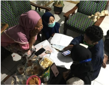
Gambar 3. Pendampingan pengisian formulir IUMK dan pendaftaran NIB di OSS

modal, surat pernyataan tetangga, serta laporan keuangan.