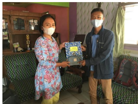
Gambar 2. Pendampingan manajemen dan pembukuan keuangan sederhana

Penerapan pengelolaan keuangan dan pembukuan yang sederhana juga dapat menciptakan kedisiplinan di dalam usaha yang dijalankan. Berdasarkan pengamatan dari pelatihan pengelolaan keuangan dan pembukuan sederhana, memberikan respon positif bagi pelaku usaha dan sangat antusias di dalam pelatihan. Hal ini disebabkan karena melalui pelatihan ini dapat meningkatkan pengetahuan dan keterampilan wirausaha di dalam membuat pembukuan sederhana sehingga meningkatkan motivasi di dalam bekerja. Sebagai tindak lanjut pelatihan, akan dilakukan pelatihan monitoring terhadap keberlanjutan kegiatan ini. Diharapkan kedepannya bukan hanya memiliki laporan keuangan yang manual dan sederhana, namun dapat juga membantu mereka untuk membuat sistem laporan keuangan yang terkomputerisasi, yang tentunya lebih memudahkan pelaku usaha.