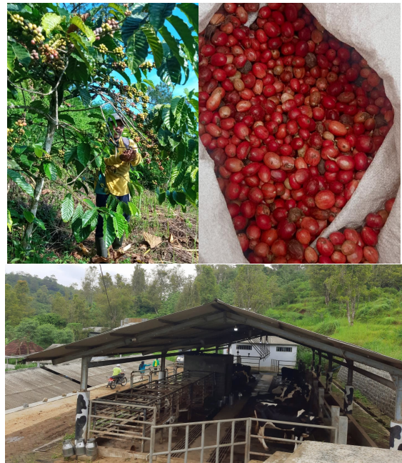
Gambar 1. Perkebunan Kopi dan Peternakan Sapi

Agrowisata Dille Willis. Dokumentasi perkebunan dan peternakan ditunjukkan dalam Gambar 1.