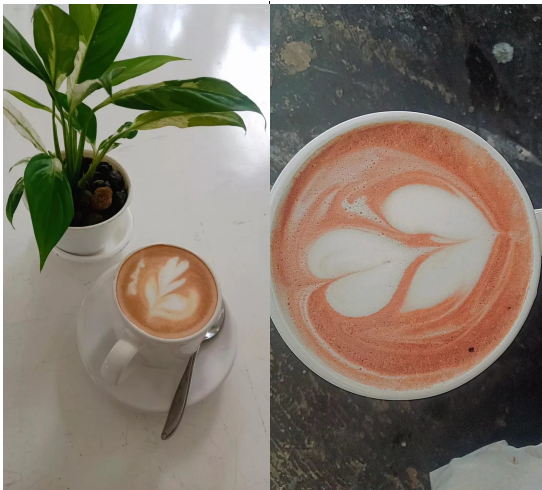
Gambar 3. Produk olahan Kopi “Coffe Latte” Agrowisata DilleM Wilis

Peserta sosialisasi antusias memulai mengaplikasikan website yang bisa digunakan pemesanan tiket, kopi dan susu perah yang langsung tersambung dengan WhatsApp. Hal ini karena tim berhasil merubah persepsi rumit menjadi mudah untuk menggunakan website yang mudah dibaca dan dimengerti oleh seluruh pengunjung. Dalam proses pembuatan website terdapat hasil dokumentasi yang nantinya akan jadi nilai jual untuk pengunjung. Dengan penyajian yang baik, sudut pengambilan foto yang tepat maka produk akan terlihat lebih menarik (Candrawati dkk., 2020). Dokumentasi hasil dari olahan produk kopi ditunjukkan dalam Gambar 3.