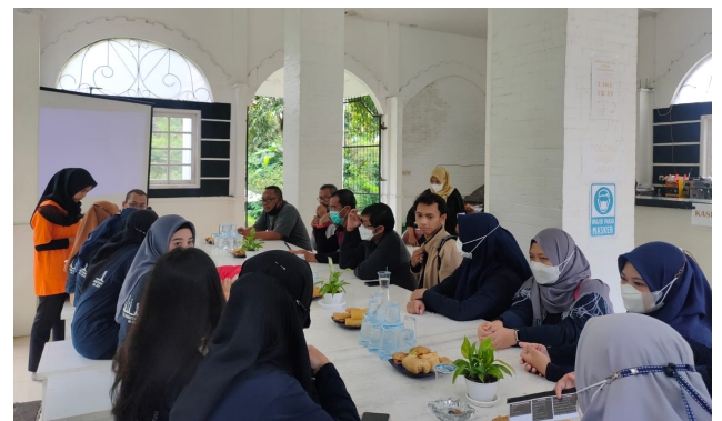
Gambar 2. Lokasi dan Kegiatan Sosialisasi Pengabdian dengan Agrowisata Dille Willis

Kunjungan ke lokasi mitra juga bertujuan untuk menyampaikan konsep pengabdian yang akan dilaksanakan untuk pihak mitra Agrowisata Dille Willis. Pihak mitra bersepakat untuk menerima kegiatan dan diadakan sosialisasi bersama anggota yang mengurus Dille Willis. Pelaksanaan sosialisasi dilaksanakan di Gedung Putih tepat berada di center lokasi Agrowisata Dille Willis. Kegiatan dikemas secara santai. Dokumentasi kegiatan sosialisasi ditunjukkan pada Gambar 2.