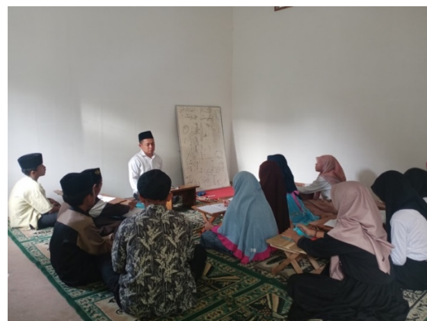
Gambar 3. Peserta tingkat Remaja

Pada pelatihan tingkat remaja ini dilakukan pada hari kamis, jam 15.00 wib, materi yang di ajarkan tentang perkenalan (التعارف بالنفس), mengenal anggota badan (اعضاء الجسم), mengenal anggota keluarga (الاسرة), alat transportasi (المواصلات), kehidupan sehari-hari (الحياة اليومية) dan mengenal makanan dan minuman (الطعام والشراب), dan diberikan beberapa kaidah-kaidah Bahasa arab, latihan soal, dan di akhir pelatihan dilakukan tes uji kompetensi. metode yang digunakan tidak jauh dari kalangan anak-anak, yaitu menghafal dan mempraktekkan hafalannya dalam kalimat percakapan, namun di tingkat ini lebih banyak permainan Bahasa, agar mereka lebih bersemangat dalam percakapan Bahasa arab. Adapun jumlah peserta dari kalangan remaja berjumlah 25 orang.