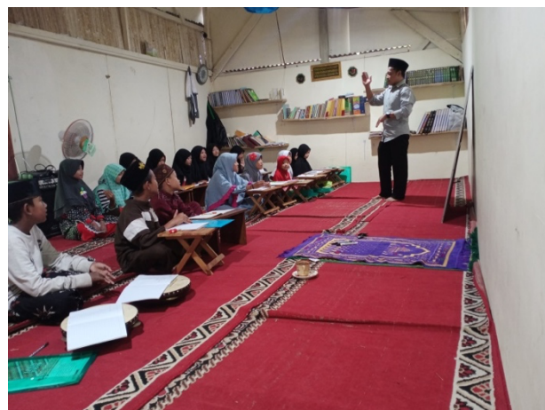
Gambar 2. Peserta tingkat anak-anak

Pada kegiatan pelatihan tingkat anak-anak dilakukan pada hari rabu jam 15.00 WIB, materi yang diajarkan adalah tentang perkenalan (التعارف), mengenal anggota badan (اعضاء الجسم), mengenal anggota keluarga (الاسرة) dalam Bahasa arab. sedangkan metode yang digunakan adalah dengan cara menghafal musfradat (kosa kata), yang kemudian di praktekkan dengan percakapan sederhana, adapun peserta dari kalangan anak-anak ini mulai dari anak SD/MI. jumlah peserta dari kalangan ini berjumlah 30 anak.