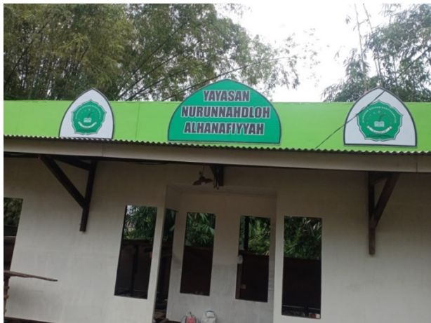
Gambar 5. Lokasi Pengabdian

Dalam kegiatan pengabdian ini terkait trik cepat berkomunikasi bahasa arab bagi masyarakat kampung Gribig pengabdi melakukan kegiatan sampai program pengabdian ini tuntas, sehingga tujuan pengabdian ini dapat tercapai. Dampak dari pelatihan ini masyarakat atau peserta pelatihan kompetensi komunikasi bahasa arabnya meningkat, terbukti ketika pengabdi melakukan ujian tes komunikasi langsung dengan peserta sudah sedikit mengalami perkembangan dalam pemahaman makna mufradad, cara menyusun kalimat yang benar, pemilihan kata yang tepat, cara pengungkapan nada kalimat yang sudah sesuai dengan maksud dari kalimat ungapannya. Gambar 6 menjelaskan peningkatan kemampuan peserta dalam beberapa jenjang saya pengabdi dapatkan sebelum dan sesudah diadakan pelatihan.