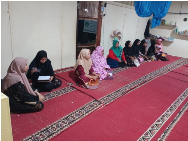
Gambar 4. Peserta tingkat Dewasa

di gunakan membaca dan langsung di praktekan dalam percakapan, jumlah peserta dari kalangan dewasa berjumlah 13 Orang (lihat Gambar 4).