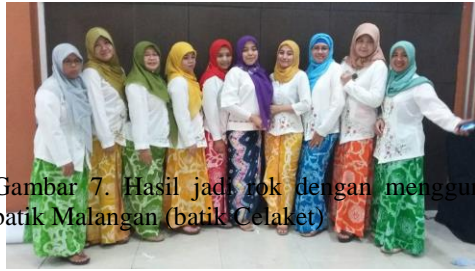
Gambar 7. Hasil jadi rok dengan menggunakan batik Malangan (batik Celaket)