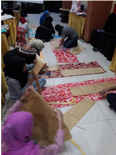
Gambar 4. Memotong bahan untuk rok