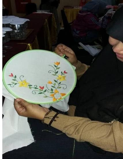
Gambar 6. Menyulam motif hias pada Kebaya

sesuai dengan desain yang telah dibuat, seperti terlihat pada gambar kebaya karya peserta pelatihan dibawah ini.