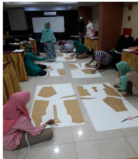
Gambar 3. Meletakkan pola diatas kain