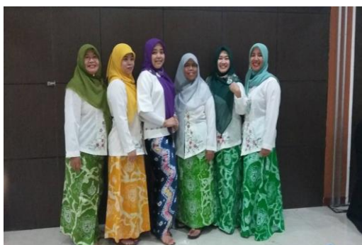
Gambar 5. Hasil jadi Kebaya dan Rok