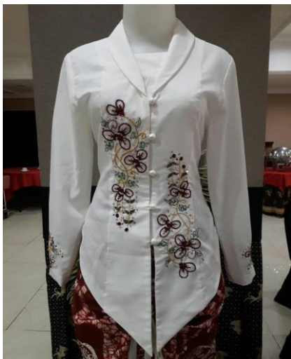
Gambar 1. Kebaya dan Sulaman tangan

Membuat pecah pola kebaya dan rok sesuai desain, peserta dapat membuat beberapa pecah pola ( pattern drafting ) kebaya dan rok. Pembuatan pattern drafting tersebut, bisa dikembangkan ke pecah pola lainnya sesuai desain yang diinginkan, misalnya; lengan kebaya dapat dibuat \frac{3}{4} atau lengan panjang, bahkan lengan pendek. Begitu juga panjang dan pendek kebaya, dapat dinaik turunkan sesuai mode yang dikehendaki. (Viani, 2001) Belahan tengah muka kebaya juga dapat dimodifikasi dengan atau tanpa belahan dimuka, sehingga letak hiasan sulaman dapat lebih luas diletakkan di area bagian badan muka.