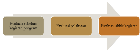
Gambar 4. Tahapan Evaluasi Kegiatan

Evaluasi akhir kegiatan adalah langkah akhir yang mengukur pencapaian tujuan akhir dari program. Pada tahap ini diharapkan POKDARWIS menjadi pemangku kepentingan yang terbuka, menjaga infrastruktur, mampu mengetahui tren moodboard , feed dan juga konten potensial yang dapat meningkatkan minat pengunjung. Dengan demikian, inilah yang menjadi tolak ukur keberhasilan program kegiatan yang ditawarkan (Gambar 4).