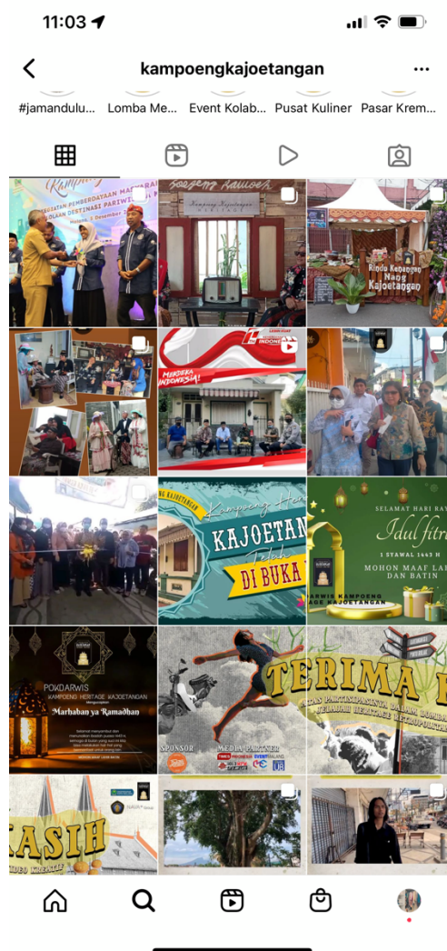
Gambar 2. Penataan Feed Akun Resmi Kampoeng Kayoetangan

penyerapan informasi wisata yang kurang optimal untuk mengenal wisata Kampoeng Kayoetangan Heritage (Qurrata dkk., 2021; Yusida dkk., 2022). Terakhir, kondisi wilayah wisata di Kampoeng Kayoetangan Heritage yang belum menggunakan street artwork sebagai alternatif papan informasi yang lebih memikat untuk dilihat dan juga bentuk 3D yang lebih kreatif (Ley, 2023). Papan artwork ini belum dimanfaatkan secara maksimal di area wisata di Kota Malang.