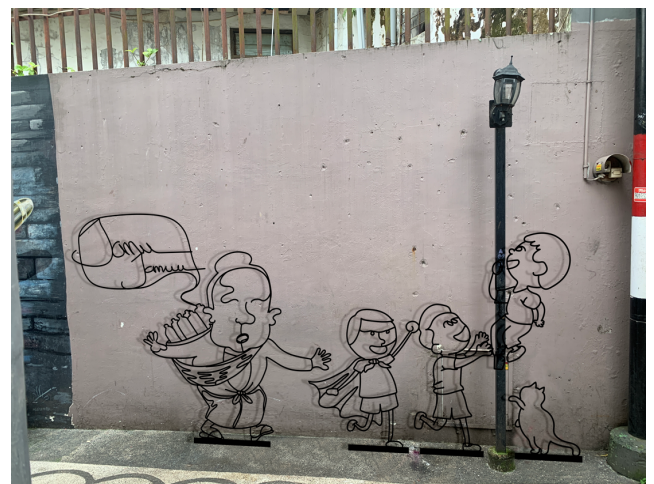
Gambar 7. Ilustrasi Konstruksi Artwork Final Model

Meskipun beberapa di wilayah kota masih ditemukan penjualnya, akan tetapi tidak banyak yang menjajakan dengan cara menggendong, lebih banyak menggunakan sepeda. Tak jarang pula saat ini banyak yang menggunakan sistem online baik melalui sosial media maupun e-commerce untuk menjual jamu tradisional. Hal ini tentunya membuat jamu tradisional yang dibuat dengan metode sederhana dan rimpang rumahan ini "naik kelas".