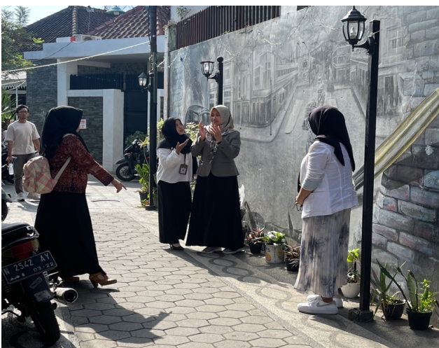
Gambar 5. Observasi Awal oleh Tim

Dalam proses pelaksanaan pembuatan street artwork menggunakan besi las yang akan dibentuk seperti papan 3D yang di design menceritakan Kayoetangan Heritage serta mencakup informasi penting di area wisata. Street Artwork yang dalam pengabdian ini belum pernah dijumpai di kota Malang sehingga diharapkan dapat menjadi icon baru di Kampong Kayoetangan Heritage. Selanjutnya, pelatihan pembuatan attractive content ini dimaksudkan untuk meningkatkan efektifitas informasi yang dibagikan di akun resmi Kampong Kayoetangan Heritage sehingga dapat lebih menarik perhatian pengunjung (Gambar 5).