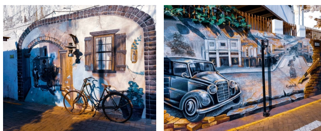
Gambar 1. Mural Art di Kampoeng Kayoetangan

Kampoeng Heritage Kayoetangan adalah salah satu kampung budaya di Kota Malang (Mulyadi dkk., 2021; Pramono dkk., 2021; Yusida dkk., 2022). Diresmikannya kampung heritage ini bertujuan meningkatkan daya tarik wisatawan guna meningkatkan perekonomian setempat dan Pendapatan Asli Daerah Kota Malang melalui sektor pariwisata. Lokasi kampung wisata ini berada di tengah kota dan merupakan kompleks perkampungan tua yang berada di koridor Kawasan Kayutangan (Gambar 1).