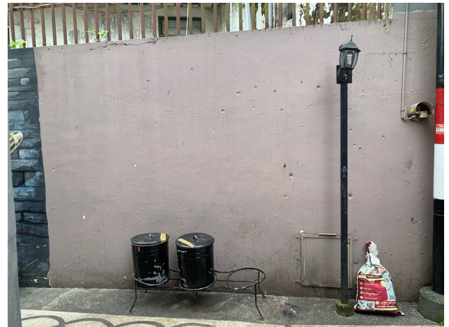
Gambar 6. Area Sebelum diberikan Street Artwork

hanya karena peminat yang terus menurun akan tetapi transportasi modern membuat jamu gendong tak lagi dilirik masyarakat secara luas (Hersoelistyorini dkk., 2016).