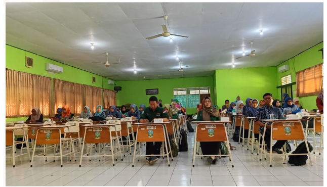
Gambar 2. Pelaksanaan Pelatihan Secara Luring

Hari kedua, pelatihan dilakukan secara luring. Pelatihan secara luring dilaksanakan di auditorium SMKN 1 Boyolung Kab. Tulungagung.