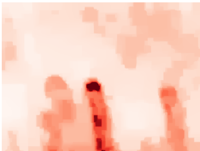
Gambar 2. Hasil yang diperoleh setelah menghilangkan noise.