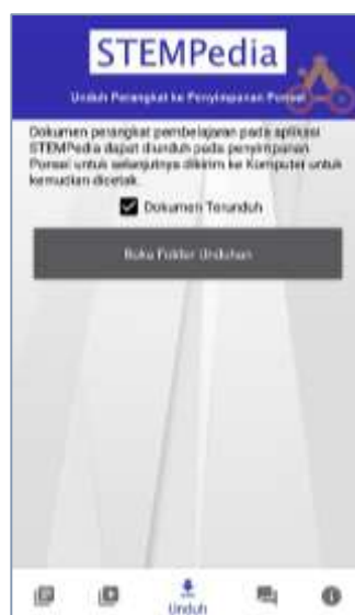
Gambar 5. Tampilan Menu Unduhan

Menu selanjutnya yaitu, menu unduhan. Penggunaan dokumen perangkat pembelajaran tentu diperlukan juga dalam bentuk cetak. Untuk memenuhi kebutuhan tersebut maka pada aplikasi STEMPedia ditambahkan fasilitas untuk mengunduh dokumen. Sehingga semua berkas dokumen perangkat pembelajaran dapat dipindahkan ke dalam penyimpanan ponsel. Dengan begitu, jika memungkinkan, berkas dapat dicetak langsung. Atau bisa juga dengan cara mengirimkannya ke perangkat komputer untuk dicetak.