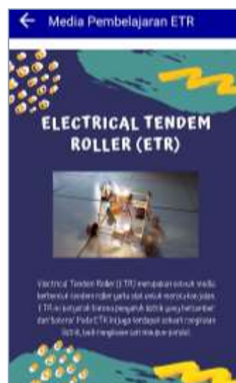
Gambar 3. Tampilan Pembaca Dokumen

Setiap ikon dapat dipilih untuk memunculkan perangkat pembelajaran sesuai dengan judulnya. Semua dokumen dapat ditampilkan langsung pada aplikasi tanpa memerlukan aplikasi lain yang berfungsi sebagai penampil dokumen. Tampilan yang muncul dalam menampilkan dokumen, sama seperti aplikasi pembaca dokumen pada umumnya, hanya saja lebih sederhana.