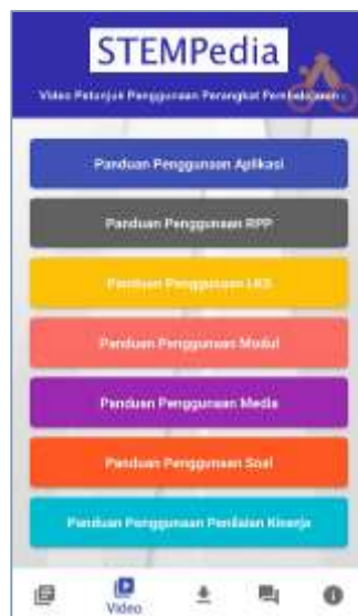
Gambar 4. Tampilan Menu Video

Selanjutnya terdapat menu kedua yaitu, menu video. Menu tersebut berisi video yang menjelaskan seluruh konten dan petunjuk penggunaan aplikasi STEMPedia . Selain itu, terdapat juga video petunjuk panduan penggunaan dari setiap perangkat pembelajaran yang ada. Sehingga selain mempelajari dengan cara melihat langsung dokumen, pengguna dapat juga mempelajari perangkat pembelajaran dengan cara menonton video.