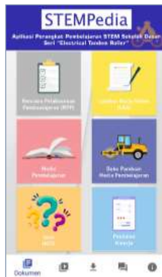
Gambar 2. Tampilan Menu Dokumen

Pada menu dokumen, terdapat semua dokumen perangkat untuk dipelajari atau digunakan pada pelaksanaan pembelajaran STEM . Penyediaan perangkat pembelajaran dalam aplikasi didapat melalui penelitian STEM yang dilakukan oleh peneliti lain dalam satu kelompok tim pengembang perangkat pembelajaran STEM . Maka kebutuhan tersebut telah tersedia dan dapat langsung dimasukkan menjadi komponen pada aplikasi. Untuk memudahkan dalam menampilkan dokumen perangkat pembelajaran, maka dokumen dibuat dalam format berkas PDF yang memiliki tingkat kesalahan minim pada saat pembacaan pada alat (komputer dan ponsel) yang berbeda. Perangkat pembelajaran yang disediakan pada aplikasi mobile learning model pembelajaran STEM yaitu: LKS, modul pembelajaran, RPP, buku panduan media pembelajaran, soal evaluasi dan rubrik penilaian.