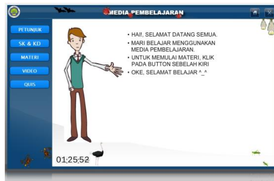
Gambar 2. Tampilan sambutan Multimedia Interaktif

Hasil pengembangan yang disusun ialah multimedia interaktif dengan sub bahasan hubungan makan dan dimakan antar makhluk hidup. Produk program berisi materi berupa teks, seni grafik, bunyi, animasi, dan video kemudian juga disediakan soal latihan untuk anak didik agar guru bisa mengetahui sejauh mana anak didiknya memahami materi. Program ini dibuat dengan desain yang sederhana namun menarik supaya anak didik bias focus pada sub bahasan yang ditampilkan dalam format Exe . Pemilihan warna dan Font yang diterapkan pada aplikasi dimaksudkan supaya keterbacaan isi dari sudut kontras, warna maupun keterbatasan jenis tulisan meningkat.