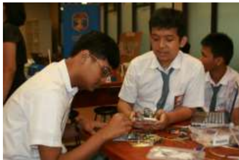
Gambar 3. Contoh Gambar dengan Resolusi Cukup

(untuk menghindari pelanggaran klirens etik penelitian, maka setiap gambar yang menampilkan wajah manusia dan gambar hewan harus menyertakan dokumen klirens etik, apabila tidak memilikinya sebaiknya tidak memasukan gambar yang memunculkan wajah manusia)