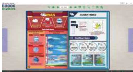
Gambar 1. Tampilan flip mode pada materi awan dan curah hujan

Konten dalam e-book infografis tersusun dari materi lapisan atmosfer, unsur-unsur cuaca dan iklim, klasifikasi iklim, dan vegetasi alam menurut iklim. E-book infografis terdiri dari bagian sampul, kata pengantar, sekilas tentang media, daftar isi, daftar istilah, identitas media, peta konsep, materi-materi, rangkuman, evaluasi, daftar pustaka, kunci jawaban, dan profil pengembang.