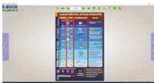
Gambar 2. Tampilan single mode pada materi karakteristik lapisan atmosfer

Berdasarkan data hasil uji validasi produk e-book infografis dari ahli materi, diperoleh keseluruhan hasil sebesar 93,35%. Berdasarkan kriteria tingkat kelayakan (Arikunto, 2010) yang