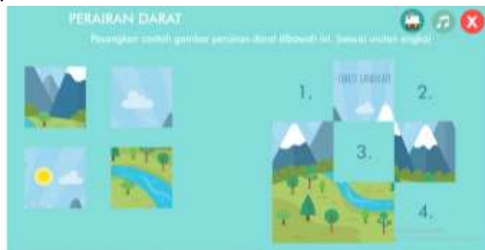
Gambar 3 Contoh bagian game pada multimedia interaktif

Pengembangan multimedia interaktif berbasis gamifikasi materi dinamika hidrosfer mata pelajaran Ilmu Pengetahuan Sosial, Adapun User Interface multimedia interaktif bagian game adalah sebagai berikut: