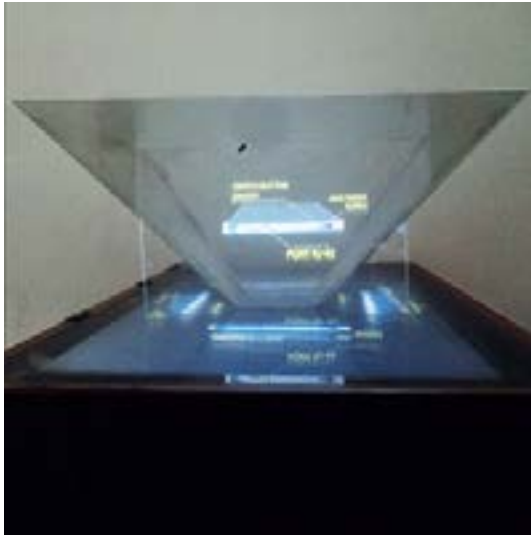
Gambar 4 Obyek 3D pada piramida hologram