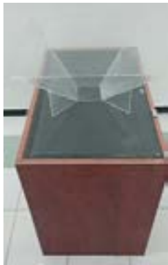
Gambar 2 Meja berpiramida hologram Bahan Ajar Obyek 3D

digunakan untuk menempatkan piramida hologram di atas atap pintu akrilik yang didalamnya terdapat televisi. Spesifikasi mejanya dengan panjang 80 cm, lebar 50 cm dan tinggi 70 cm dengan penutup akrilik berukuran sama. Piramida hologram terbuat dari bahan akrilik yang difungsikan untuk merefleksikan gambar yang muncul dari televisi. Piramida disusun oleh empat segitiga yang berukuran sama dan dipotong atasnya, sehingga piramida bisa berdiri di atas meja. Spesifikasi piramida hologram, kotak persegi menghadap ke atas berukuran 56 x 56 cm, sedangkan persegi kecilnya berukuran 10 x10 cm dengan tinggi 60 cm. Hasil pengembangan meja berpiramida hologram dapat dilihat pada gambar 2.