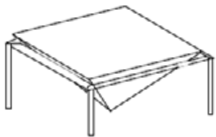
(a) Struktur Desain