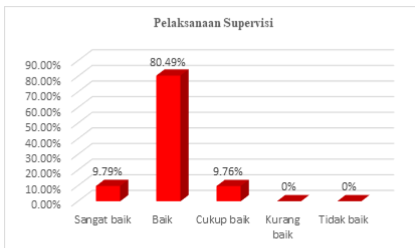
Gambar 3 Pelaksanaan Supervisi Akademik

Supervisi dilaksanakan sesuai dengan jadwal yang telah ditetapkan. Supervisi sudah mengikuti prinsip integral yaitu terintegrasi dengan program pendidikan secara keseluruhan. Kepala sekolah juga sudah menggunakan prinsip demokratis, obyektif, humanis dan konstruktif, namun belum menerapkan prinsip berkesinambungan. Supervisi dilaksanakan secara terprogram namun belum kontinyu. Kepala sekolah merasa tugas-tugasnya terlalu banyak sehingga pelaksanaan supervisi terhambat.