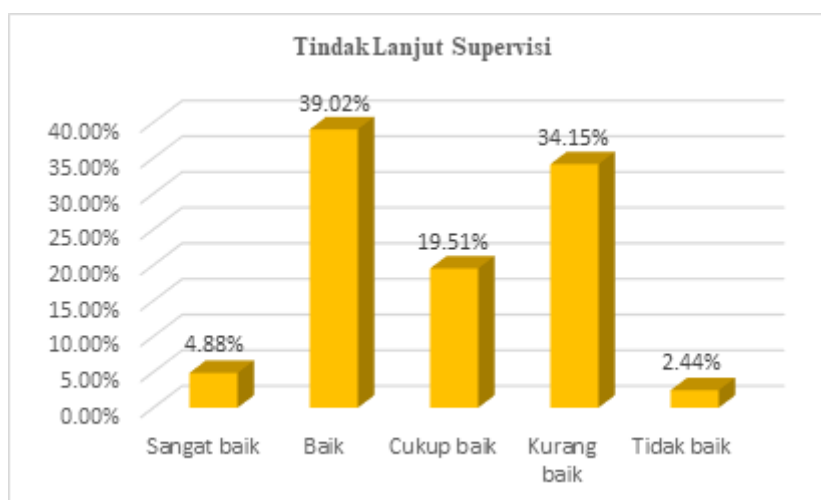
Gambar 4 Tindak Lanjut Supervisi

disupervisi, namun hasil evaluasi supervisi belum dijadikan sebagai pertimbangan dalam menyusun program supervisi berikutnya.